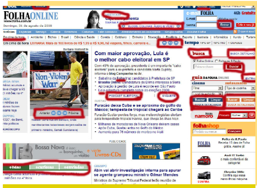
Fig. 2. Folha Online, 2008, redundância e uso de setas no espaço tridimensional que é a web