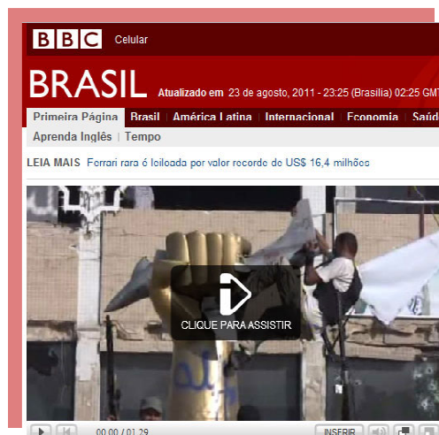
Fig. 5. Versão brasileira de destaque em vídeo da BBC , 2011.

Por outro lado, havia (e ainda há) jornais com mais de 100 chamadas em sua interface principal, como o Times 8 . De novo o exemplo do jornal americano é esclarecedor. Alguém lê tudo isso? Ou seja, um exaustivo uso do valor-notícia de composição no qual prevalece a noção de que quase tudo é importante. Isso passa ao largo da tentativa de reorganizar o que David Weinberg chamou de miscelânea na internet .