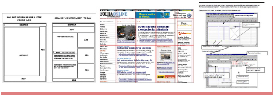
Fig. 1. Diagramação da Folha Online entre layout web (esq.) e impresso (dir.)

Curioso anotar que, ao longo dos últimos anos, transposta para a internet ( web e aplicativos, entre outros), a ideia segundo a qual a organização se dá por critérios de noticiabilidade e valor-notícia de composição levou a extremos – da absoluta economia ao total exagero. O exemplo da Folha de S.Paulo apresentado na próxima página (Fig. 2) é exemplo disso: as setas imitando um controle remoto de tevê se assemelham à interface do projeto Movie Map 7 , do Massachusetts Institute of Technology, desenvolvido por Andrew Lippman em 1978.