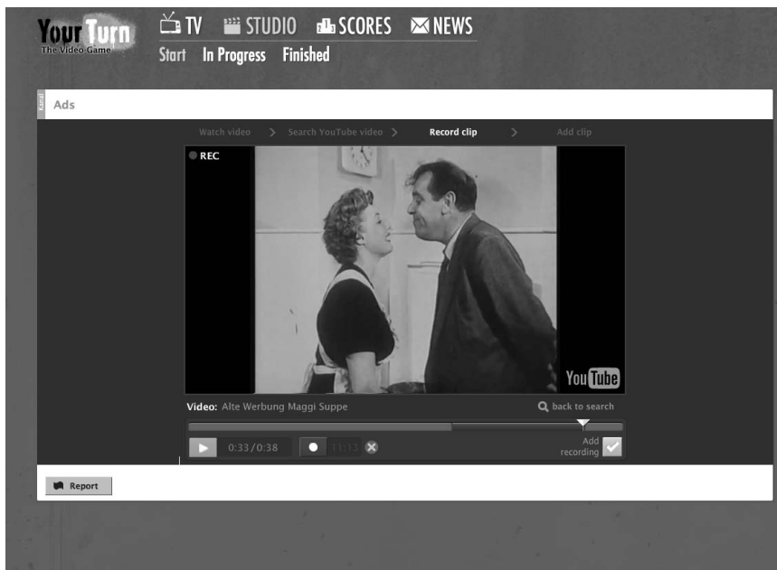
Abbildung 3: YourTurn – Auswahl des Ausschnitts aus einem YouTube-Video

Zusammengefasst handelt es sich bei YourTurn um ein Spiel, das sich um die Alltags-Mediengewohnheiten von Jugendlichen und um soziale Interaktion und Kommunikation unter diesen dreht. Reflexion spielt eine wichtige Rolle: Erstens geschieht im Rahmen der Auswahl eines kurzen Ausschnitts eine Auseinandersetzung mit den Video-Inhalten. Zweitens bringt die Konfrontation mit den Assoziationen anderer SpielerInnen andere Blickwinkel zum Vorschein. Diese Aspekte können im durch Medien-/SozialpädagogInnen/JugendarbeiterInnen betreuten Spiel besonders produktiv bearbeitet werden. Zur Verwendung von YourTurn schreibt Katharina Gollonitsch (Jugendarbeiterin Bassena Stuwerviertel), die den Praxiseinsatz getestet hat (Gollonitsch 2013): „Das Spiel, pädagogisch eingesetzt, birgt die Möglichkeit, an seinen Handlungs- und Ausdrucksmöglichkeiten zu arbeiten und sich zu trauen, die eigene Idee auch zu verfolgen und zu artikulieren. [...] Selbst- und Fremdwahrnehmung, mögliche Missverständnisse in der (online-) Kommunikation, Manipulierbarkeit von Inhalten oder unterschiedliche Interpretationsmöglichkeiten von Informationen sind mögliche Themen.“