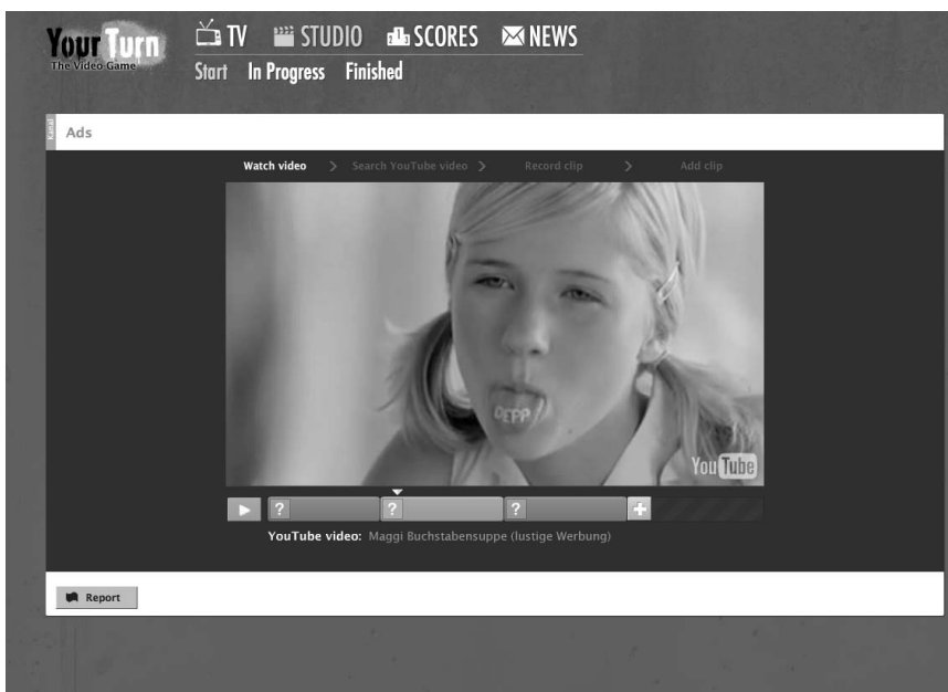
Abbildung 2: YourTurn – unfertiger Videomix

In der ersten Interviewwelle erhoben wir die online-Gewohnheiten sowie Musik- und Spielvorlieben der Jugendlichen. Das in der Folge entwickelte Spiel baute auf deren gemeinsamen Interessen auf: Musik-Konsum, YouTube- und Facebook-Nutzung sowie das Spielen von online-Spielen. Das Grundprinzip des Facebook-Spiels YourTurn! Das Video-Spiel ist das gemeinsame Erstellen von Mixes aus YouTube-Videos durch zwei oder mehrere SpielerInnen – wir fordern also die Kreativität unserer jugendlichen Zielgruppe. Die SpielerInnen wählen abwechselnd kurze Ausschnitte aus (Musik-)Videos, die auf der online-Plattform YouTube verfügbar sind, und erstellen so gewissermaßen gemeinsam ein neues Video (genauer: einen Videomix). Sowie die ausgewählten Ausschnitte aller am Videomix beteiligten SpielerInnen insgesamt eine Minute Länge erreicht haben, ist der Mix fertiggestellt. So lange die SpielerInnen am Mix arbeiten, sind sie anonym, erst nach dessen Fertigstellung werden die AvatarInnen sichtbar, die daran beteiligt waren. Über die AvatarInnen ermöglicht das Spiel auch das Aufrufen der jeweiligen Facebook-Profile, über die dann die Kontaktaufnahme zwischen den beteiligten SpielerInnen möglich wird.