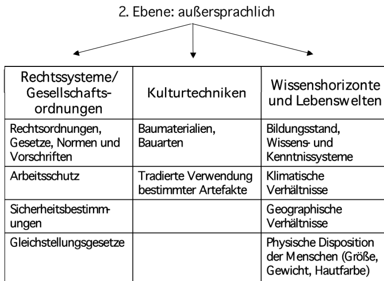
Abb. 2: Außersprachliche Ebene

Diskursive oder kommunikative Praxen stellen nach unserer Auffassung keine besonderen Tätigkeiten im Unterschied etwa zu „praktischen“ Tätigkeiten dar. Ausgehend von unserer Textdefinition können wir sagen, dass die sprachlich-schriftliche Seite und die materielle Seite zwei miteinander verbundene Aspekte einer insgesamt diskursiven Praxis sind. Fruchtbare Ansätze hierzu liefert u.a. die Kritische Diskursanalyse (Jäger 2001). Jäger erläutert diesen Zusammenhang am Beispiel eines Hausbaus: