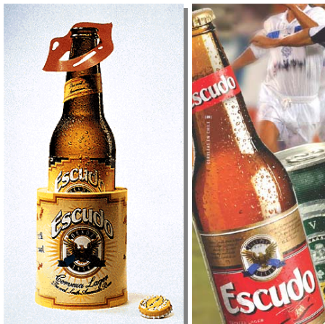
Links: Design „made in Germany“, um das chilenische Bier Escudo auf den deutschen Markt zu bringen. Rechts: das Bier Escudo für den chilenischen Markt.

Das Fehlen eines Länder-Images zeigt sich auch in einigen nationalen Produkten für das Ausland. Das Unternehmen Compañía Cervecerías Unidas (CCU) exportierte 1998 und 1999 das Bier Escudo nach Deutschland. Um dies zu tun, mußte CCU das Bier Escudo einer erheblichen Designmodifikation unterzogen werden.