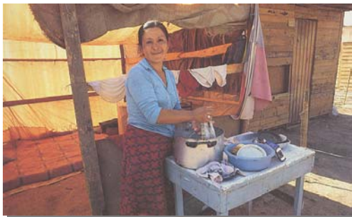
Fotografie einer armen chilenischen Frau in einem europäischen Reiseführer. APA Guides 1996.

Warum gibt es so große Unterschiede in den Darstellungen von Chile – sowohl im touristischen wie im wirtschaftlichen Bereich, wenn sie von Europäern gemacht werden und wenn sich Chile selbst präsentiert?