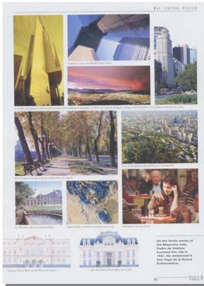
Der Stil einer Kollage – die Modernität ist fotografiert, die Vergangenheit ist gemalt. Offizielles Prospekt der Corporación de promoción del turismo , Chile (1997).

kommunikative Anstrengungen unternommen, um auf sich aufmerksam zu machen: z. B. an der Wall Street und in Weltorganisationen. All diese Anstrengungen waren ohne Zweifel notwendig und lobenswert, wie die letzten internationalen Abkommen zeigen (Freihandelsabkommen mit der EU, den USA und Korea). Aber das Fehlen des am Kunden orientierten Images von einem Land ist ein großes Defizit. Eine mögliche Erklärung wäre die Differenz zwischen Selbst- und Fremdbild. Ein überzeugendes Länder-Image könnte positive Synergien erzeugen, sowohl im Bereich von Import und Export, als auch für nationale Investitionen. Auf der Weltausstellung in Sevilla 1992 hat sich Chile mit einem „Eisberg“ als nationales Symbol präsentiert, um sich von anderen lateinamerikanischen „tropischen“ Ländern abzugrenzen. Es gab eine große Polemik über den „Eisberg“, der als Symbol wenig verständlich und plausibel erschien. Weder für die Chilenen selbst noch für den Rest der Welt. Für die Entwicklung eines positiven Länder-Images hat