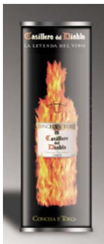
Diese Verpackung des Weines hat in Deutschland häufig zu Verwechslungen mit Whiskey geführt.

Die Winzerei Viña Concha y Toro brachte im Jahre 2001 den Wein Casillero del Diablo als erste chilenische Marke mit globalem Charakter auf den Markt. Das Ziel war ehrgeizig: es sollte sowohl der Verkauf gesteigert werden als auch der Wert der Marke verbessert werden. Die Weinmarke Casillero del Diablo sollte ein Produkt sein, das weltweit populär und bekannt ist wie der Rum Bacardi oder Coca-Cola.