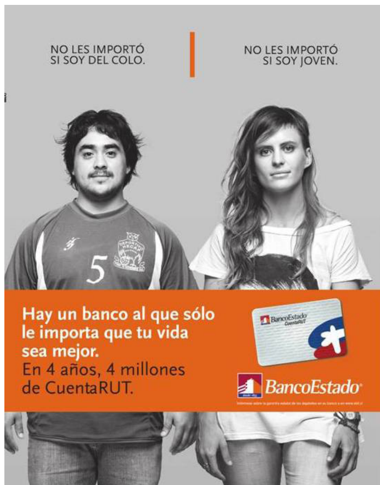
Abb. 3: Quelle: Las Últimas Noticias, Seite 27. URL: http://www.lun.com/Pages/NewsDetail.aspx?dt=2011-11-16&PaginaId=27&bodyid=0 . 10