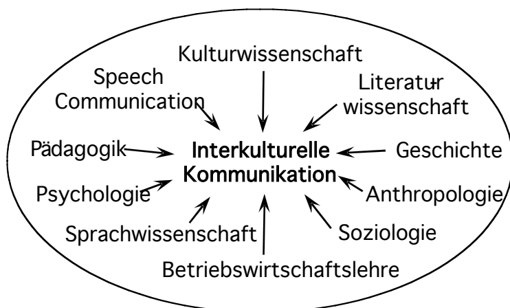
Abb. 3: Die Interdisziplinarität Interkultureller Kommunikation. Quelle: Lüsebrink (2005:5)

licher Fächer bzw. Bezugsdisziplinen aufgegriffen werden (Bolten 2005). Dementsprechend hat sich z.B. „Interkulturelle Kommunikation“ wissenschaftshistorisch auch erst auf dem Wege eines Fachgrenzen überschreitenden Fragens und Forschens konstituieren können (Lüsebrink 2005:3ff). Als ein „Mehr“ von Bezugsdisziplinen wie z.B. der Sprachwissenschaft, der Psychologie, der Soziologie oder der Wirtschaftswissenschaft markiert und vernetzt es deren Schnittstellen, ohne dabei jedoch auf diese „Kernfächer“ verzichten zu können.