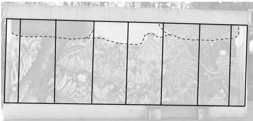
Abb. 2: Feldlinien (Vorderseite)

Mittels der im Zuge der „planimetrischen Komposition“ (Imdahl 1996, S. 480) eingezeichneten Feldlinien wird vor allem deutlich, dass nahezu die gesamte Fläche für die Darstellung des „Dschungels“ und nur ein verhältnismäßig kleiner Teil für die Abbildung des „Anderen“ – des Himmels – genutzt und zudem beidseitig über die rahmende schmale Fläche hinaus Farbe angebracht wurde (s. Abb. 2). Hier wird der Versuch deutlich, die topografische Grenze zu überwinden und in den umliegenden Raum ein- bzw. übergreifen zu wollen.