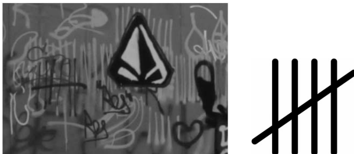
Abb. 6: Ausdrucksgestalt und Zählzeichen in Fünferbündelung

Neben den typografischen und botanischen Ausdrücken sind zudem Symbole wie das Logo einer Lifestyle-Markte für jugendliche Kleidung und Zählzeichen erkennbar (s. Abb. 6).