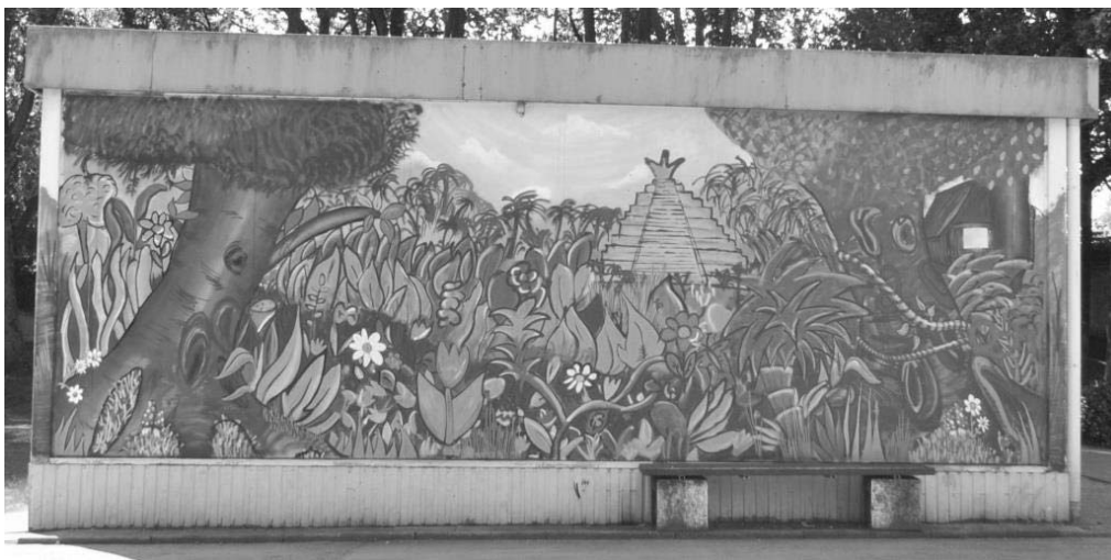
Abb. 1: Vorderseite des Pavillons

Auf der dem Schulhof zugewandten, somit vorderen Seite des Pavillons wird eine über- wiegend grüne Fläche mit diversen farblichen Akzentuierungen sichtbar, die strukturelle Ähnlichkeiten mit einem dichten Wald im Sinne des tropischen Regenwalds („Dschungel“) oder einem verwilderten Garten aufweist (s. Abb. 1).