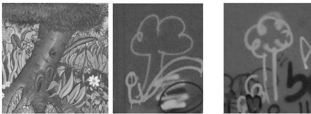
Abb. 4: Baum (Vorderseite) und Bäume (Rückseite)

Die gleichsam subjektiv-individuellen sowie interaktiv-kollektiven Protokolle ergeben folglich ein zwar hochgradig heterogenes, in der Gesamtheit jedoch stimmiges Ganzes, das im absoluten Kontrast zu der Vorderseite kein gemeinsames Thema verhandelt, sich jedoch in Form formal „wildwüchsiger“ und sich indifferent neben- und aufeinander befindender Fragmente rhizomatisch ausdifferenziert. Die stilisierten, Fauna und Flora zitierenden Ausdrucksgestalten wie Bäume, Pilze, Palmen oder Insekten (vgl. Abb. 4 und 5) stellen eine interpretierte Zitation des vorderseitigen, stringenten (Regen-)Waldthemas dar und lassen sich entsprechend wie das Cover eines originalen Musikstücks auffassen.