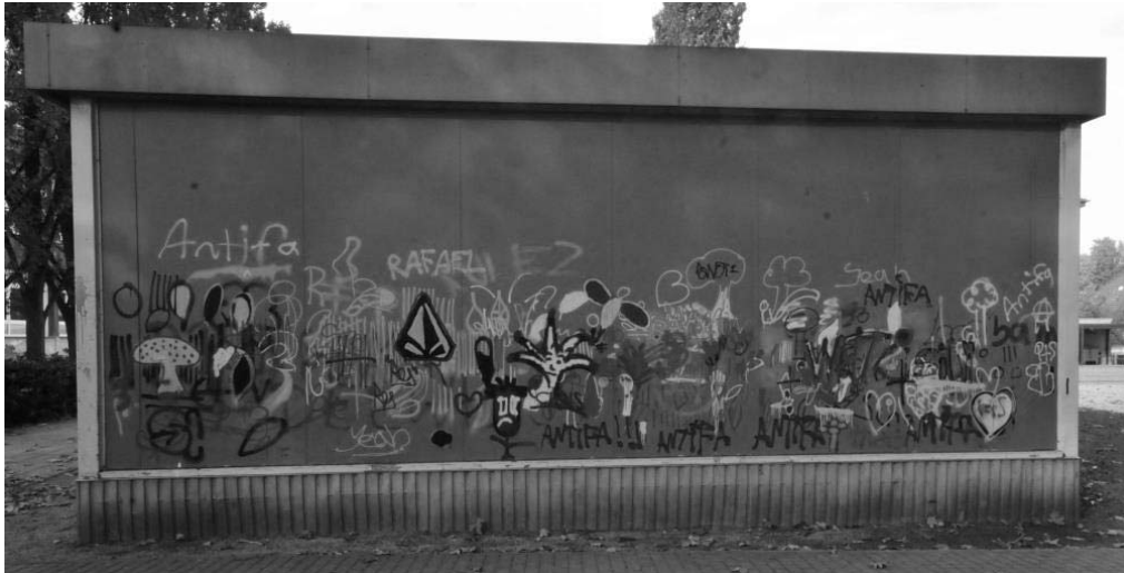
Abb. 3: Rückseite des Pavillons

bole, Kommentierungen und Schriftzeichen (s. Abb. 3). Hier kann eine interaktiv-dialogische Aneignung des schulischen Raums attestiert werden, wohingegen vorderseitig eine monologisch-direktive Maskierung vorliegt (s. Abb. 2).