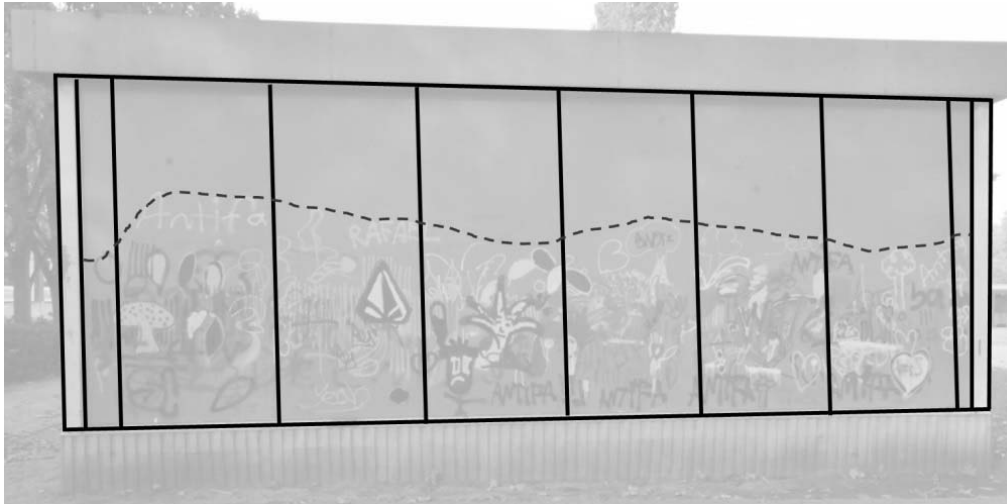
Abb. 7: Feldlinien (Rückseite)

Werden nun wiederum Feldlinien eingezeichnet, so wird deutlich, dass die Grafiken – im Gegensatz zu denjenigen der Vorderseite – lediglich etwa die untere Hälfte der gesamten Fläche bedecken (s. Abb. 7).