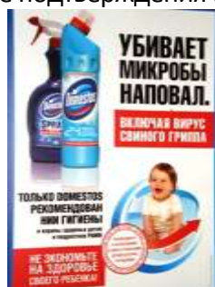
Рисунок 2. Пример позиционирования «проблема – решение».

Данный способ отвечает на вопросы: «Какую проблему целевого рынка может решить товар компании? Каким способом? Почему это наиболее эффективно?». Считается одним из самых сильных видов позиционирования, так как для потребителя стремление решить проблему является самым актуальным мотивом к совершению покупки. Например, «Domestos — убивает все известные микробы, наповал» (Рис. 2). Существует несколько условий, которые позволяют увеличить эффективность использования этого способа. В первую очередь, у потребителя должна существовать проблема и желание ее решить. Во-вторых, товар должен действительно решать конкретную проблему и иметь необходимые подтверждения своей эффективности.