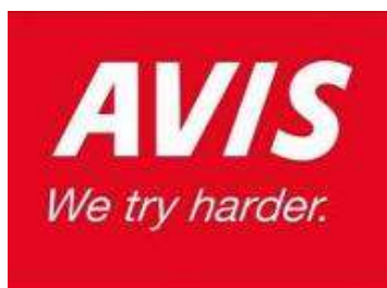
Рисунок 4. Пример позиционирования «против конкурента».

При использовании этого вида позиционирования компания должна противопоставить себя конкуренту с целью отнять у него часть рынка. Данный способ хорош для фирм, стоящих на второй позиции после лидера. Причем акцентируются собственные слабые стороны. Так, агентство Avis, занимающее второе место в прокате автомобилей, сделало это своей сильной стороной: "Мы - вторые. Мы стараемся больше других" (Рис. 4).