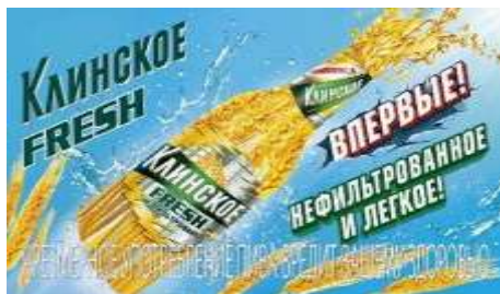
Рисунок 1. Пример позиционирования «против товарной категории».

Классическим примером может стать позиционирование легкого пива против обычного пива (Рис. 1).