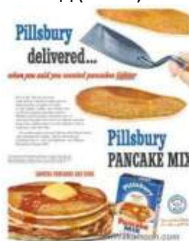
Рисунок 8. Пример позиционирования «по отличительным характеристикам продукта».

Данный способ формирует превосходство товара компании в какой-либо отдельной области, позволяя сфокусировать внимание потребителя на отличительных его свойствах. В качестве примера можно привести компанию «Pillsbury», которая успешно позиционировала муку для приготовления выпечки как «муку с идеями» за счет того, что в каждую упаковку продукта вкладывала рецепты блюд. Данное свойство отличало достаточно обычный стандартизированный товар от товаров конкурентов, предоставляя своим потребителям возможность обновления и улучшения своих блюд (Рис. 8).