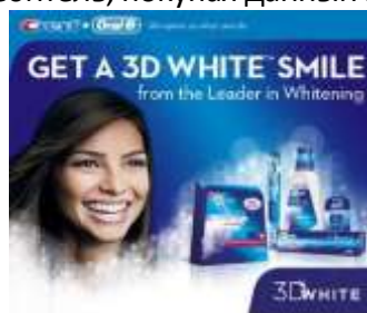
Рисунок 7. Пример позиционирования «по основной выгоде».

Позиционирование в этом случае описывает результат, который получает потребитель, покупая товар. Например, «Crest» продавал свою зубную пасту с фтором (характеристика продукта), как пасту, помогающую эффективно бороться с разрушением зубной эмали (выгода). Именно это качество и приобретал потребитель, покупая данный продукт (Рис. 7).