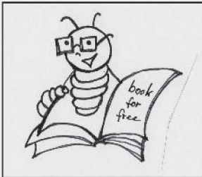
Buddie – der Bücherwurm von budrich academic

Füttere Buddie mit Deiner Buchbesprechung!