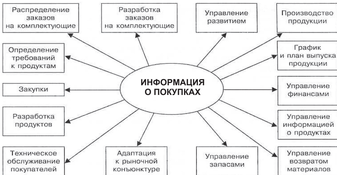
Рис. 2. Реализация ориентации на интересы покупателя в CSRP-системах

1. Управление взаимоотношениями с потребителями в электронной коммерции унифицируется и компьютеризируется. Производитель не