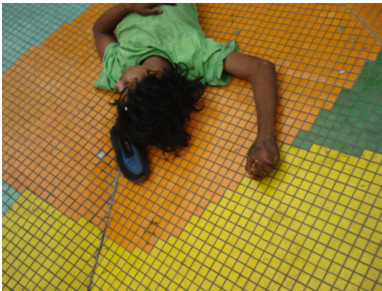
Tomado de Jose Fernando Valencia

Fruto de estos nuevos espacios institucionales en la ciudad, en el año 1997 se inicia una discusión formal alrededor en la Red Paisa Joven, ya que esta planteó una forma organizativa por sectores (privada, academia, ONGS e iglesias) y fue allí donde se introdujo la propuesta, de la necesidad de contar con un sector comunitario, que desde lo territorial barrial hablará con vos propia, con autonomía y conocimiento propio. Esta propuesta se elaboró entre algunas organizaciones que se denominaban comunitarias. Esto se planteaba ya que las ONGS de profesionales, instrumen-