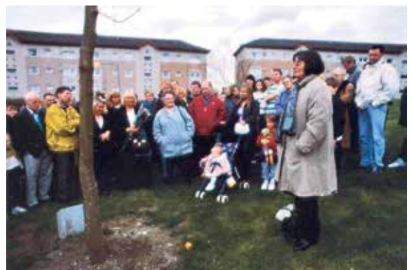
Foto 4: Mit einem gemeinsamen Spaziergang werden die Bäume offiziell eingeweiht. Auf dem Stein links neben dem Stamm ist zu lesen, wem der Baum gewidmet ist.

Der Baum, der zerstört wurde, war einem Jugendlichen gewidmet, der durch einen Unfall ums Leben gekommen war (vgl. Foto 5). Der Verstorbene war ein Fan von einem der beiden Clubs gewesen und seine Freunde hatten dem Baum einen Schal in den entsprechenden Farben umgebunden. Das war Graham Fagen zufolge für einige Anhänger des anderen Teams Grund genug, den Baum zum Ent-