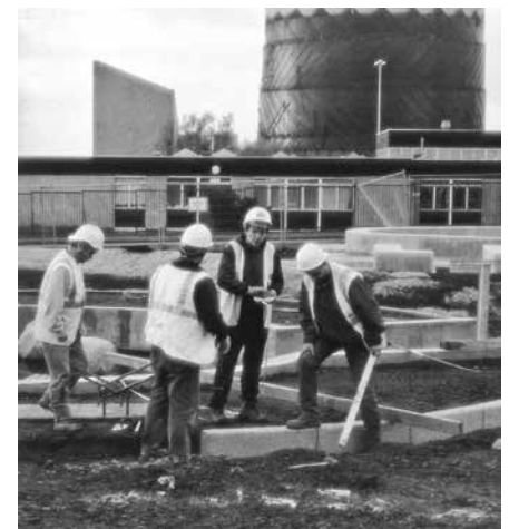
Foto 2: Der Molendinar Park am östlichen Ende der Royston Road wird gebaut.

innen und Bewohner verbessert werden (vgl. THE ROYSTON ROAD PROJECT 2002). Über diese weichen Aspekte hinaus sah das Projekt den Erhalt des Kirchturms und die Anlage zweier Parks vor. Neben dem Spire Park am westlichen Ende der Royston Road beinhaltete der Antrag die Schaffung eines weiteren Parks am östlichen Ende der Straße (vgl. Abb. 2). Die beiden Parks waren als Klammer gedacht, mit der die Quartiere stärker miteinander verbunden und das Zusammengehörigkeitsgefühl der Bewohnerinnen und Bewohner gestärkt werden sollte. Außerdem sollten bei der Umsetzung der Baumaßnahmen Arbeitsplätze geschaffen werden, wovon man sich Impulse für die soziale und wirtschaftliche Entwicklung des Stadtteils erhoffte.