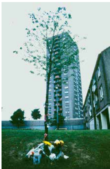
Foto 5: Blumen und Geschenke schmücken einen Baum, der einem verstorbenen Jugendlichen gewidmet ist.

Die realisierende Dimension wird von DE CERTEAU beschrieben als Realisierung des sprachlichen Systems durch das Spre-