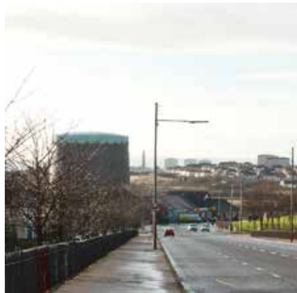
Foto 1: Die Royston Road ist ca. zweieinhalb Meilen lang und führt ungefähr von dem Standort, von dem das Bild aufgenommen worden ist, zum mittlerweile sanierten Townhead Spire im Hintergrund.

Hinter der Bezeichnung Royston Road -Projekt verbergen sich verschiedenen Maßnahmen zur Stadtteilentwicklung, die in den Jahren 1998 bis 2001 im Nordosten der schottischen Metropole Glasgow durchgeführt wurden (eine Dokumentation findet sich unter roystonroadproject.org ). Das Projekt hatte die Aufwertung mehrerer benachteiligter Quartiere entlang der Royston Road zum Ziel (vgl. Abb. 1). Die Idee zur Durchführung der Maßnahmen geht auf das Jahr 1997 zurück, als die – im Westen des Entwicklungsgebiets gelegene – baufällig gewordene Townhead and Blochairn Parish Church abgerissen wurde (vgl. THE ROYSTON ROAD PROJECT 2002). Damals schlossen sich engagierte Anwohnerinnen und Anwohner zusammen, um zumindest den Abriss des Kirchturms noch im letzten Moment zu verhindern. Unter dem Namen Spire and Park Group forderten sie die Behörden auf, den Turm zu sa-