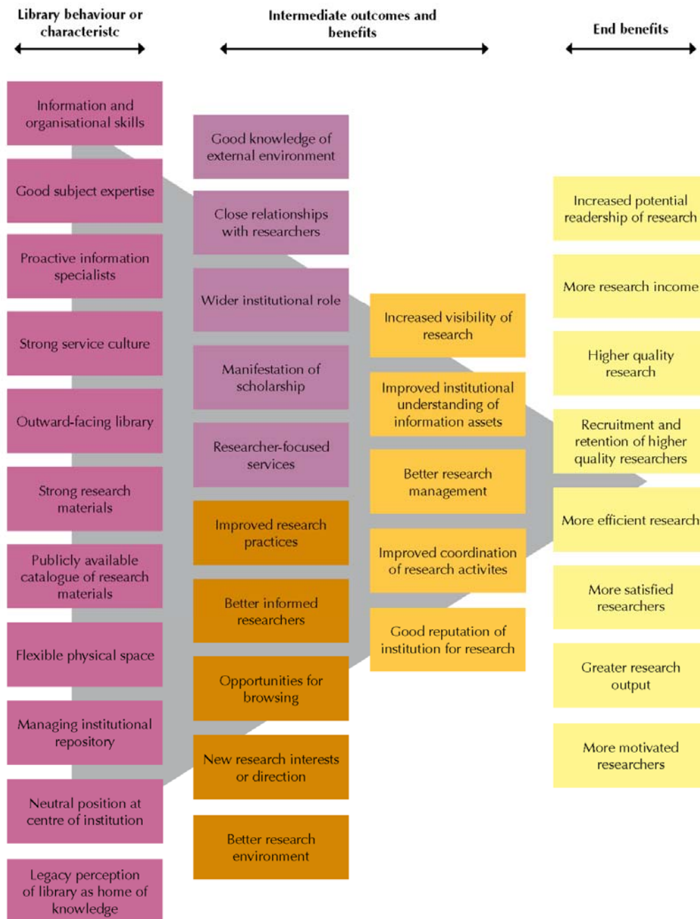
Abb. 3: Die informationsfachliche Expertise der Bibliothekarinnen und Bibliothekare führt im Kontext der wissenschaftlichen Informationsversorgung zu einem erheblichen Zugewinn an Qualität und Quantität in der Forschung (aus Ohne Autor, 2011b). Der Wandel des Informationsverhaltens der Wissenschaftlerinnen und Wissenschaftler erfordert jedoch eine Anpassung und Erweiterung dieser Expertise, um insbesondere die geforderte hohe Qualität der Informationsversorgung auch in Zukunft zu gewährleisten.

samen Studie von Research Information (RIN) und Research Libraries UK (RLUK) illustriert in anschaulicher Weise, wie wissenschaftliche Bibliotheken mit ihrem Wissen und ihrer Erfahrung eine hoch qualitative Informationsversorgung für die Wissenschaft gewährleisten können (Ohne Autor, 2011b; s. Abb. 3).