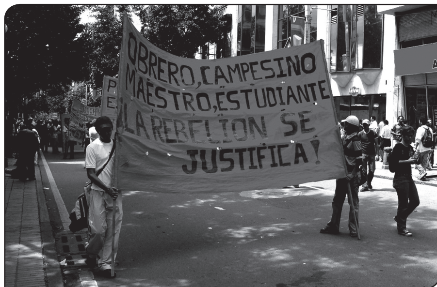
(Bogotá 2007)

acceso, lugar de refugio para los elementos marginales de la “sociedad mayor”, esto es, de indígenas, afrodescendientes, colonos y delincuentes. A pesar de su ausencia estructural, el Estado colombiano, con una actitud que podría ser definida como esquizofrénica, ha intentado imponer su soberanía -entendida, en este caso, como mero ejercicio del poder- a lo largo y ancho de estas tierras que ya no lo reconocen. Y ha intentado hacerlo a través de aquel discurso ideológico hoy en día tan en boga, que se sustenta en las nociones de desarrollo y seguridad a toda cuesta. El precio de esta lógica lo ha pagado la población local, expuesta y sin defensas frente a la voluntad de quien quiere aprovechar el potencial económico de esta esquina de América, sin ningún respeto por su medio ambiente y sus pobladores.