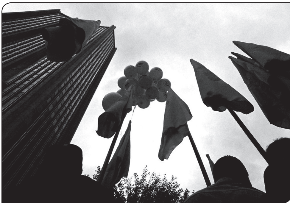
(Bogotá 2006)

ción científica entre los pobladores nativos y el “diálogo” con sus saberes, y la cogestión equilibrada de las riquezas naturales. Sin embargo, estas propuestas se encuentran en radical oposición con la estrategia actualmente predominante de “top-down management”, es decir, aquel mecanismo de imposición de los conocimientos tecnológicos y científicos de las culturas hegemónicas a la cotidianidad de aquellas que, en términos gramscianos, llamaríamos subalternas, con el indisoluble objetivo de sustentar el esquema productivo capitalista (Gramsci, 1996). Como científicos sociales, debemos “caminar la palabra” y dirigirnos hacia un encuentro de civilizaciones (nativos, afrodescendientes y “occidentales”), en contraposición con la perspectiva pesimista de Samuel Huntington, aquel teórico neoconservador norteamericano que, en su apología de la tecnocracia occidental, ha propuesto el choque de civilizaciones como un escenario futuro para el mundo globalizado (Huntington, 1993). Esta visión se basa en el supuesto según el cual, en caso de conflicto, necesariamente hay un gana-