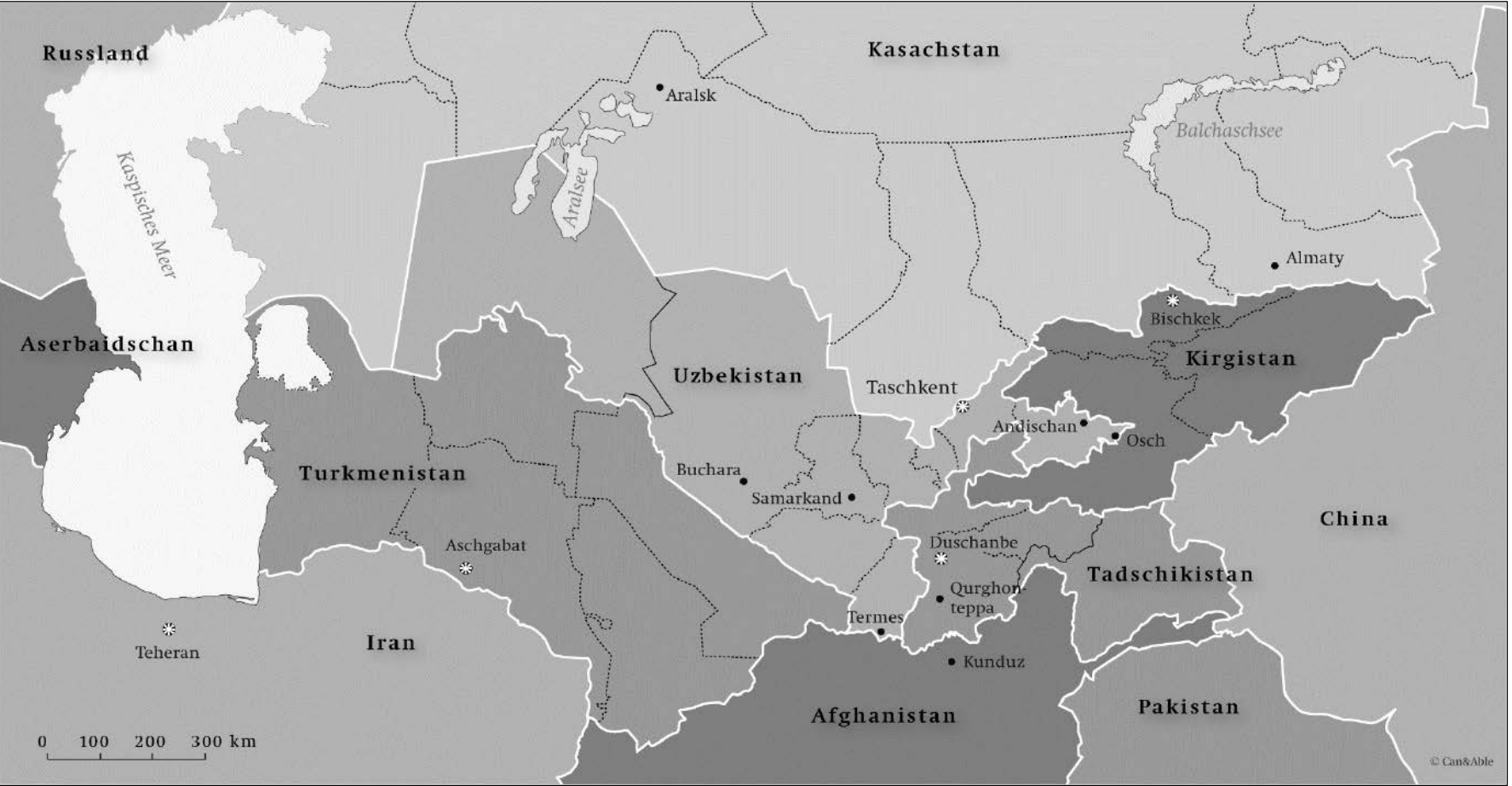
Karte 1: Zentralasien

SWP Berlin Islam in Tadschikistan März 2015