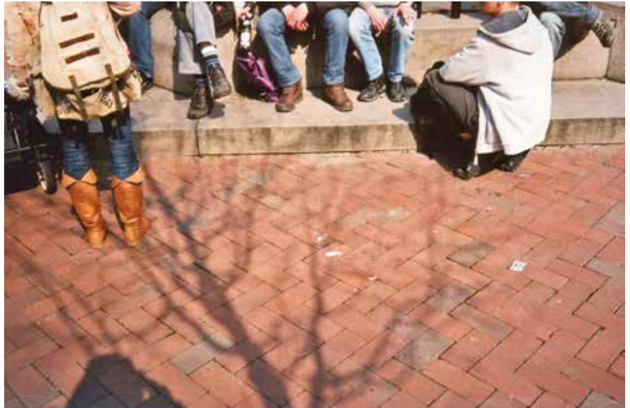
Foto 3: Praktiken der Raumaneignung auf dem Vinetaplatz

Jutta: „Und dazu kommt – das ist jetzt ein ganz trauriger Aspekt – die-