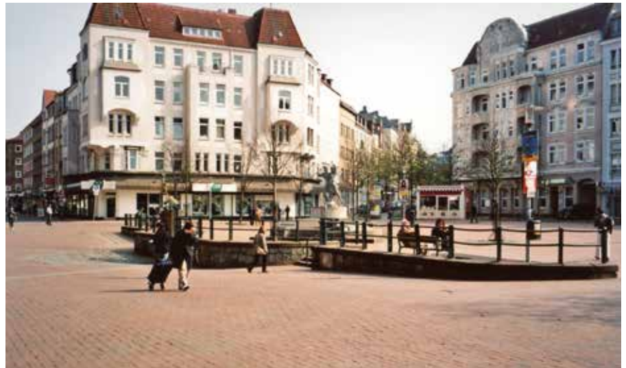
Foto 1: Vinetaplatz mit typischer Gründerzeitbebauung

Durch die gewählte Methodik, welche beobachtende, fotografische und interviewende Verfahren miteinander kombiniert, sollen dem einleitenden Problemaufriss folgend vor allem diejenigen, die im städtischen Kontext bisher nicht oder allenfalls als Problem thematisiert wer-