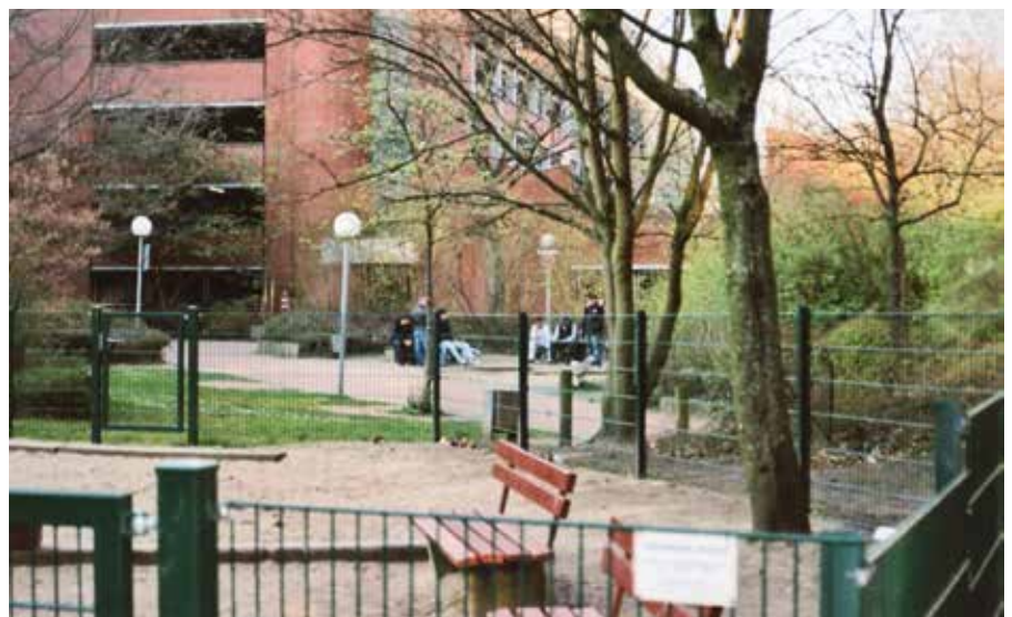
Foto 5: Treffpunkt von Drogenkonsumenten im Park

Jutta: „Es gibt natürlich Razzien, das ist natürlich so. Die habe ich selber auch schon mitgemacht. Ja und natürlich werden dann die Papiere verlangt. Keine spitzen Gegenstände, das ist klar, weil die Leute müssen sich natürlich davor hüten, dass man ihnen unterstellt: hier wird ge junkt, hier gibt's Spritzen oder sonst irgendwas. Das ist verpönt, die Leute werden sofort einkassiert.“