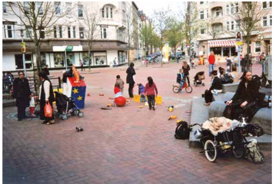
Foto 6: Szenemitglied mit Kindern auf dem Vinetaplatz

Von Seiten der Mehrheitsgesellschaft wird in der Raumeignung durch Mit-