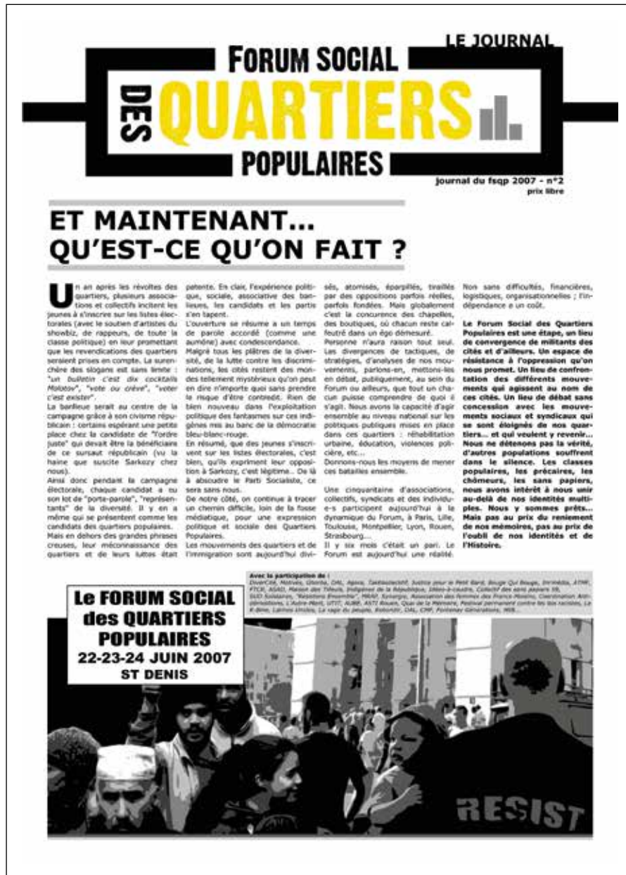
Abb. 1: FSQP-Journal No 2 – Forum social des quartiers populaires

Vor der Untersuchung gegenhegemonialer Sprecherpositionen stellt sich zunächst die Frage nach einer Operationalisierung der verwendeten Diskurstheorie. Ansätze, welche der postulierten Offenheit, Brüchigkeit und Heterogenität von Diskursen nachkommen, bietet das von ANGERMÜLLER (2007) vertretene Modell der diskurspragmatischen Aussagenanalyse französischer Tradition, das aus