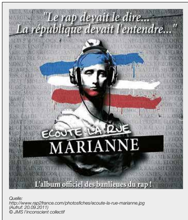
Abb. 2: Werbe-Cover Écoute la rue Marianne (geändert)

der international lange wenig beachteten linguistischen Foucault-Rezeption in Frankreich hervorging. Somit steht dieses Modell in Gegensatz zu anderen Operationalisierungsvorschlägen der Diskursforschung innerhalb der deutschen Sozialwissenschaft. So gehen etwa die von Reiner Keller oder Siegfried Jäger vertretenen Ansätze von sehr stabilen Strukturen eines Diskurses und dessen Homogenität aus, bauen z.T. auf relativ autonomen Subjekt-Konzeptionen auf (vgl. WRANA 2012), und bieten deshalb wenige Anknüpfungspunkte an die oben skizzierte Diskurstheorie. Gemäß der Konzepte der Aussagenanalyse organisieren lokale, temporale, personale bzw. relationale und hierarchische „Sprachmarker“ eine Äußerung und darin getroffene Aussagen auf einer formalen Ebene, welche instruierend bei der letztlich fragilen Festschreibung von Bedeutung fungiert. Charakteristische formale Spuren der Sprache bilden hierbei Deiktika, Vorkonstrukte und Polyphonie. Anhand der Formalität von Sprache im Äußerungskontext lassen sich Textstellen mit Quartiersbezug zunächst außerhalb eines engen hermeneutischen Rahmens analysieren. Hierbei gibt die Materialität den LeserInnen