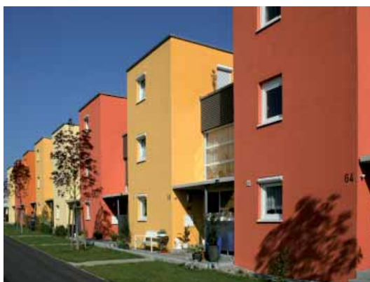
Reihenhäuser in Ostfildern/Scharnhäuser Park

Die Bevölkerung wuchs weiter, der Wunsch nach den eigenen vier Wänden war nach wie vor stark. Im Jahr 1995 wurde die Eigenheimzulage als staatliche Fördermaßnahme eingeführt. Mit Beginn der 1990er-Jahre bot sich in manchen Städten und Gemeinden noch einmal eine Chance, in die Fläche zu gehen. Durch den Rückzug der alliierten Streitkräfte stehen Bebauungsflächen zur Verfügung. In Ostfildern, in der Nähe von Stuttgart entsteht zum Beispiel der Scharnhäuser Park – ein neues Wohngebiet, in dem neben Reihenhäusern auch Geschosswohnungen und Gewerbeobjekte gebaut werden. Das Konzept des „SchaPa“ wurde in der ersten Hälfte der 1990er-Jahre nach Abzug der Amerikaner entwickelt. Ziel war zum einen die Befriedigung des Bedürfnisses junger Familien nach einem bezahlbaren Eigenheim, zum anderen aber auch der Bau einer Modellsiedlung energieeffizienter Gebäude, die regenerative Energiequellen nutzen. 4