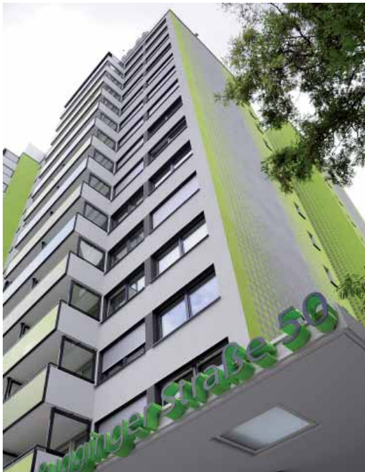
Passivhochhaus Weingarten

Das neue Jahrtausend brachte dann den Wandel von der Förderung der „Quantität“ zur Förderung der „Qualität“ und zur Förderung von Maßnahmen, die den Wohngebäudebestand verbessern sollen. Im Jahr 2006 wurde die Eigenheimzulage wieder abgeschafft. 5 Dem Programm Stadtumbau Ost aus dem Jahr 2002 folgte 2004 das Programm Stadtumbau West. Die Kreditanstalt für Wiederaufbau (KfW) bietet spezielle Programme für „Modernisierung + altergerechtes Wohnen“ im Bestand an und für den Neubau für Energiespar- und Passivhäuser. 6