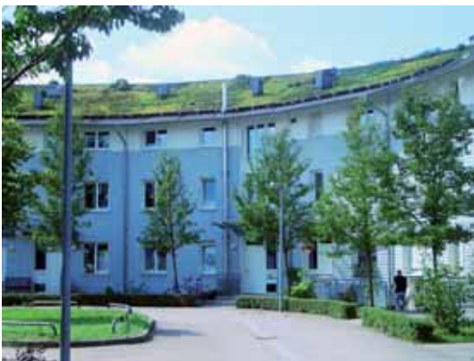
Wohngebiet Oberreut (Karlsruhe)

fort. Es wurde viel gebaut, die Wohnungen wurden immer größer. Durch die Entfaltung des Individualverkehrs war es kein Problem, außerhalb der Städte neue Wohngebiete zu erschließen. Flächenverbrauch war kein Thema. Ein Beispiel ist das bis heute sehr beliebte Wohngebiet Oberreut am Rande von Karlsruhe. Im Sommer 1964 bezogen die ersten Mieter die vornehmlich Kinderreichen zugedachten preiswerten Wohnungen. In drei Bauabschnitten entstand bis in die 1990er-Jahre ein neues Stadtviertel mit Reihenhäusern und Wohnblöcken sowie Gemeinschaftseinrichtungen, Gewerbeansiedlungen und einem Schulzentrum. 2