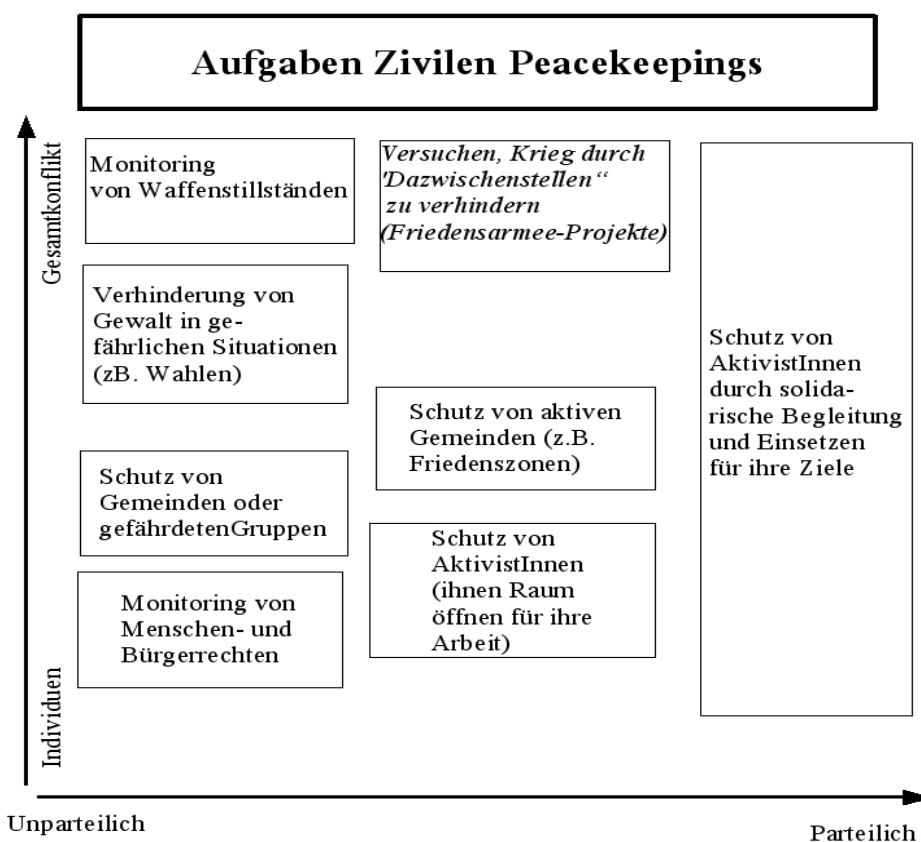
Bild 2 Aufgaben Zivilen Peacekeepings

Zwischen diesen beiden Extremen sind Projekte und Organisationen angesiedelt wie PBI oder das Balkan Peace Team in den 1990er Jahren, die sich als unparteilich ansehen und die argumentieren würden, dass sie nicht den Kampf derjenigen unterstützen, die sie begleiten, sondern dass sie vor Ort sind, um Menschenrechte zu schützen und dadurch Handlungsräume zu eröffnen.