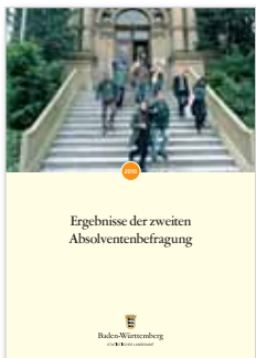
Artikel-Nr. 8061 10002

Die Publikation, die beim Statistischen Landesamt bestellt werden kann, liefert wichtige Informationen über studienrelevante Aspekte, mit denen die Absolventen bereits sehr zufrieden sind, sowie Aspekte, die eventuell verbessert bzw. weiter ausgebaut werden sollten. Zudem können die Ergebnisse auch von Personen mit Hochschulzugangsberechtigung bei der Wahl des Studiengangs und der entsprechenden Hochschule zu Rate gezogen werden. Die Absolventenbefragung bietet einen Überblick über die Studienbedingungen und die beruflichen Zukunftsaussichten. ■