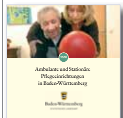
Artikel-Nr. D1226 08001