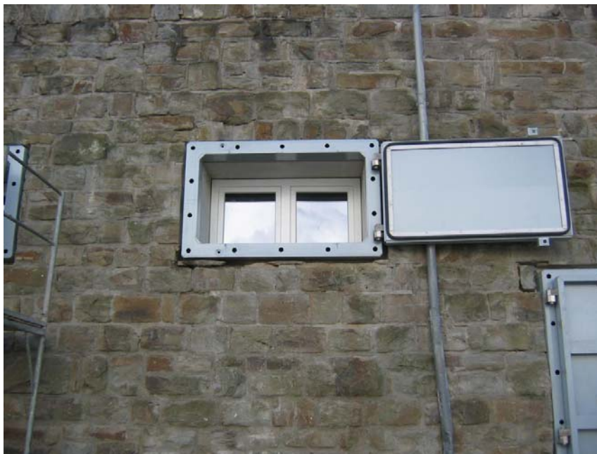
Bild 1: Beispiel für eine bauliche Eigenvorsorge – Maßnahme: Fensterschutz

Inwieweit Schätzungen zutreffen, dass Eigenvorsorge der Betroffenen bis zu 80% der materiellen Schäden verhindern kann und öffentliche Träger durch diese Maßnahmen entlastet werden (Grothmann und Reusswig 2006), kann an dieser Stelle nicht verifiziert werden. In Ballungsräumen entlang größerer Wasserstraßen wie Rhein und Elbe wird öffentlicher Schutz jenseits aller Zuweisung von Verantwortlichkeit kaum verzichtbar sein, da eben nicht nur Privateigentum, sondern auch öffentliche Infrastruktur gefährdet ist. Sowohl räumlich als auch zeitlich, beispielsweise durch Vorwarnzeiten für das Ansteigen des Pegels auf eine kritische Marke, ist die Planung dauerhafter oder akuter Maßnahmen in gewissem Rahmen möglich.