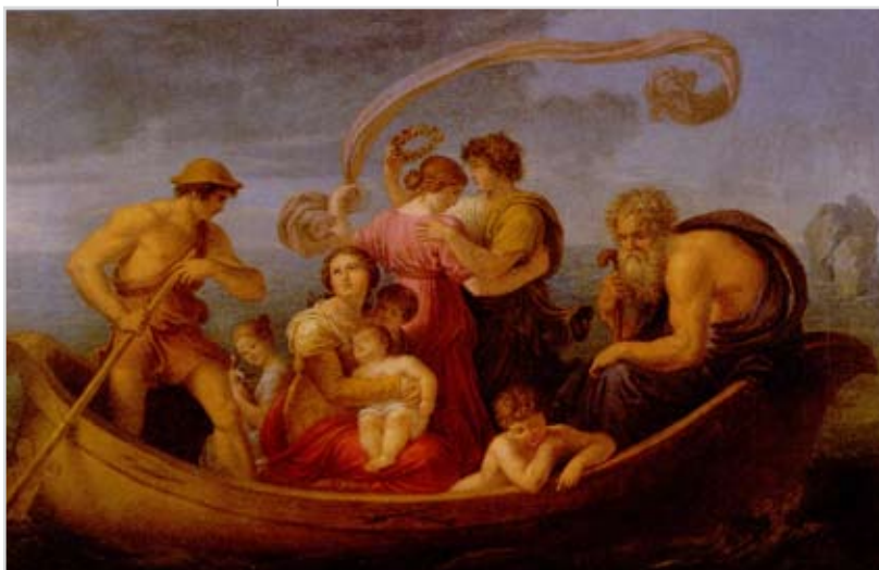
Abbildung 3: Aus: Kunst im Detail. Vom Klassizismus bis zum Biedermeier/Fotos: Peter Windstoßer, Hrsg. von der Landesbank Stuttgart Girozentrale. Stuttgart 1987.

Angestrebt wird ein glatter Verlauf der auszugleichenden Beobachtungsreihe. Beispielsweise kann in der Lebensversicherung die Verwendung von rohen Sterbewahrscheinlichkeiten zu sprunghaften Prämien führen. Bei der Glättung der 1-jährigen Sterbewahrscheinlichkeiten für die Sterbetafel 1970/71 mussten beispielsweise noch bis zu vier Teilbereiche gebildet werden. Erst durch die bahnbrechende Entwicklung der elektronischen Datenverarbeitungsanlagen wurde zum Beispiel das Spline-Ver-