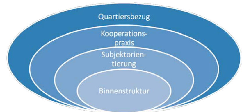
Abbildung 1 Vier konzentrische Handlungskreise (Aus: Langhanky/Frieß/Hußmann/Kunstreich 2004: 90)

Wir verwendeten den Begriff der Grammatik eines professionellen Handelns in dem Sinne, wie die Grammatik einer Sprache bestimmte Grundregeln des Gebrauchs der Sprache vorgibt. Grammatik sollte als Begriff dazu dienen, bestimmte grundlegende Formen des „WIE“ der Handlung zu identifizieren (vgl. Langhanky/Frieß/Hußmann/Kunstreich 2004: 167). Wie auch im Sprachgebrauch gibt eine Grammatik des Handelns eine Anzahl bestimmter Strukturen vor, die wiederum eine unendliche Anzahl von unterschiedlichen Handlungen oder Verhaltensweisen erzeugen können. Wir stellten weiter fest, dass diese Grammatik des Handelns im Kern zwar ähnliche, aber auf die besonderen Situationen der KiFaZ unterschiedliche Handlungen hervorbrachte; also die Grundstrukturen zwar weitgehend identisch waren, jedoch flexibel ausgerichtet werden konnten. Über die Arbeit weiterer Abstraktionsschritte erarbeiteten wir schließlich ein Konzept, das wir als „generatives Handeln“ im Anschluss an Chomsky (1981) und im Weiteren als „generative Wirksamkeit“ bezeichneten. Diesen Begriff entwickelten wir zunächst über die Assoziation der Grammatik und schließlich über den Begriff der „generativen Themen“ von Freire (1973) zur Beschreibung der identischen Grundstrukturen und Arbeitsprinzipien der KiFaZ. Den Kern unserer Handlungstheorie bilden neben weiteren theoretischen Begründungszu-