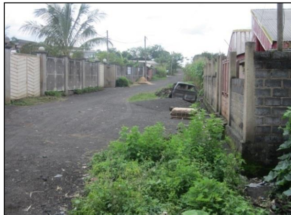
Figure 5. Constructions du quartier Bantou