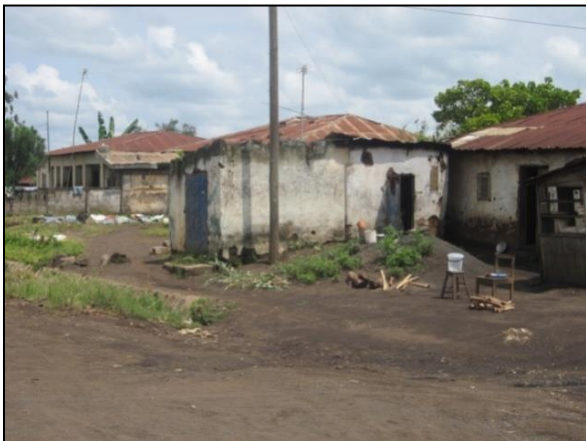
Figure 4. Maisons en terre battue des autochtones

Parmi ces nouveaux quartiers, Bantou se distingue par son peuplement et sa morphologie. Situé au sud-ouest, dans la partie de la ville dite Bonabéri 12 , il jouxte la caisserie et Kompani 13 . Son peuplement a commencé au début des années 1980 lorsque l'ancien pôle de développement de café a commencé à diversifier ses activités. Les premières habitations ici sont celles des commerçants (de divers calibres et les éleveurs de volaille) et des fonctionnaires nouvellement affectés dans la ville : enseignants, policiers ; agents de l'Etat ; moniteurs agricoles.