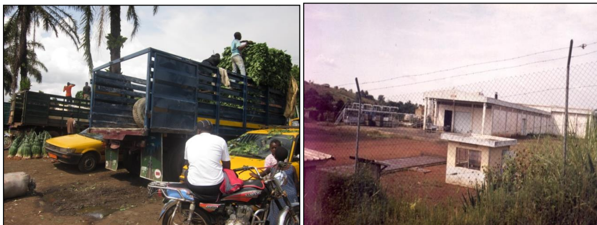
Figure 1. Le marché de vivres frais sur les terres de la CIAC Figure 2. Les locaux de l'industrie SCAN à Bantou

Le milieu urbain pénètre ainsi dans un milieu primitivement rural. Petit à petit les villages indépendants de Foumbot sur le plan de la gouvernance traditionnelle 10 sont absorbés par la ville [6]. Ceci est dû à leur proximité à la zone urbanisée (Bantou, Koudoubain, Banjou, Njimbot II, Ngouoguo) ou à leur rattachement à la ville (Njincha, Fossette, Mangoum).