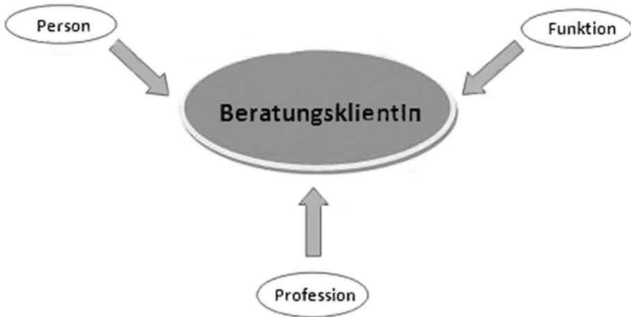
Abbildung 1: Basistriade der Beratungsklientin bzw. des Beratungsklienten

Zentral für das triadische Denken ist zudem die Idee der Prämierung eines Faktors zu einem Zeitpunkt gegenüber den beiden anderen Faktoren, das heißt, die Bevorzugung eines Faktors auf Kosten der anderen (vgl. Rappe-Giesecke 2008: 36f., 40). Dieser der Ökologie entlehnten Vorstellung liegt die Endlichkeit von Ressourcen zugrunde.