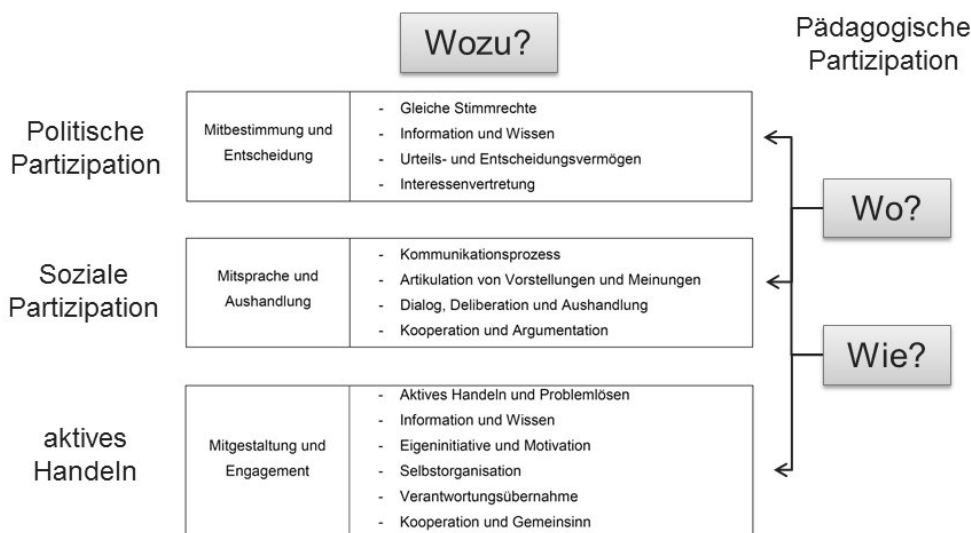
Abb. 2: Modell der Partizipationsförderung in Ganztagschulen (mod. nach Messmer 1995 und Eikel 2007)

Dafür erscheint es hilfreich, das Modell der Pädagogischen Partizipation um einen Situationsansatz zu erweitern (vgl. Deinet 1992, S. 56). Die Einführung des Situationsbegriffs in das Modell der pädagogischen Partizipation kann als Kunstgriff verstanden werden, durch den allgemein verständliche ‚Orte‘ sichtbar werden, in denen wiederum die Inszenierung einer Partizipationsförderung in konkreten Handlungssituationen möglich ist. Die vorliegende Untersuchung setzt also bei schul- und schulsportbezogenen Konzepten an und überträgt diese durch die Einführung einer situativen Komponente auf intentionale Lehr-Lern-Situationen in Ganztagsangeboten. Dieses kombinierte und am Situationsansatz orientierte Konzept kann als Modell der Partizipationsförderung in der Ganztagschule bezeichnet werden (s. Abb. 2). Im Folgenden wird das Modell in Bezug auf Bewegungs-, Spiel- und Sportangebote angewendet.