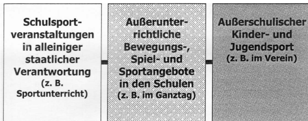
Abb. 1: Das Drei-Säulen-Modell der Kinder- und Jugendbildung im Sport ( Pack/Bockhorst 2011, S. 169; mod. nach Kohl 2004, S. 16)

Insofern geht es bei den Bewegungs-, Spiel- und Sportangeboten im Ganzttag um mehr „als nur um eine nahtlose Verlängerung von Vereinsangeboten oder nur um eine Verdopplung des schulischen Sportunterrichts“ ( Naul 2006, S. 21). Das stellt pädagogische Fachkräfte vor besondere Herausforderungen, da sie sich „pädagogisch in einem neuen Schnittpunkt zwischen einer Sozial- und Sportpädagogik “ befinden ( Naul 2006, S. 21; Hervorhebung d. Verf.). Entsprechend sind ihre Handlungsweisen auch nicht mit denen von Übungsleiter/-innen und Sportlehrkräften in ihren herkömmlichen Settings vergleichbar. Diese sportbezogenen Überlegungen dürften ebenso auf andere Angebote übertragbar sein. Ganztagsangebote im Allgemeinen und Bewegungs-, Spiel- und Sportangebote im Besonderen unterliegen damit besonderen Anforderungen (vgl. Neuber 2009). Eine wesentliche Herausforderung stellt die Förderung von Partizipation dar.