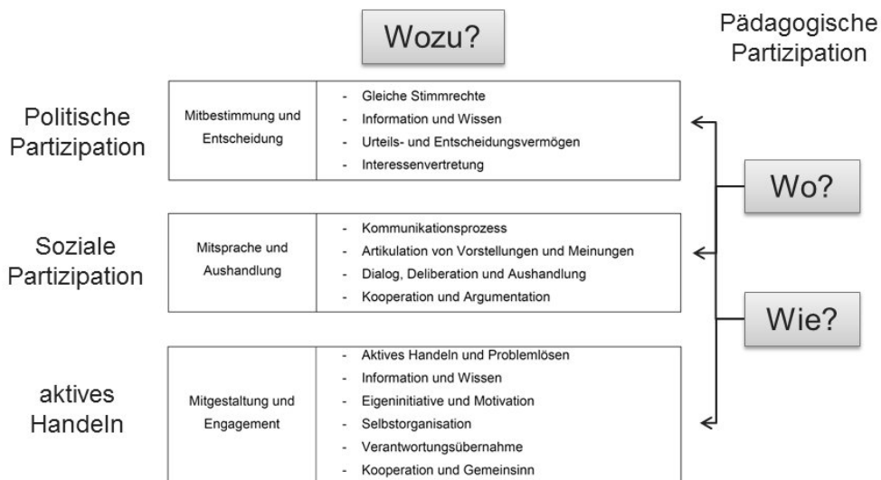
Abb. 2: Modell der Partizipationsförderung in Ganztagschulen (mod. nach Messmer 1995 und Eikel 2007)

Dafür erscheint es hilfreich, das Modell der Pädagogischen Partizipation um einen Situationsansatz zu erweitern (vgl. Deinet 1992, S. 56). Die Einführung des Situationsbegriffs in das Modell der pädagogischen Partizipation kann als Kunstgriff verstanden werden, durch den allgemein verständliche ‚Orte‘ sichtbar werden, in denen wiederum die Inszenierung einer Partizipationsförderung in konkreten Handlungssituationen möglich ist. Die vorliegende Untersuchung setzt also bei schul- und schulsportbezogenen Konzepten an und überträgt diese durch die Einführung einer situativen Komponente auf intentionale Lehr-Lern-Situationen in Ganztagsangeboten. Dieses kombinierte und am Situationsansatz orientierte Konzept kann als Modell der Partizipationsförderung in der Ganztagschule bezeichnet werden (s. Abb. 2). Im Folgenden wird das Modell in Bezug auf Bewegungs-, Spiel- und Sportangebote angewendet.