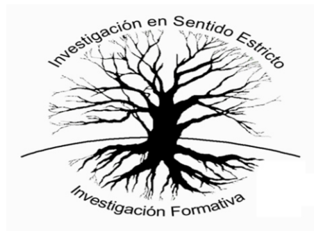
Figura 3: fuente propia

La investigación formativa semilla de la investigación en sentido estricto.