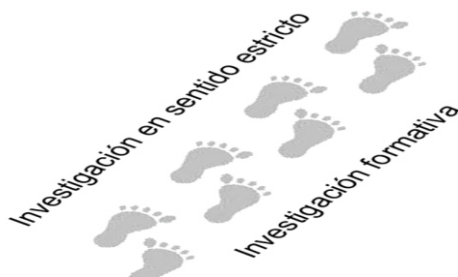
Figura 4: fuente propia

La Investigación Formativa un camino en paralelo a la investigación en sentido estricto