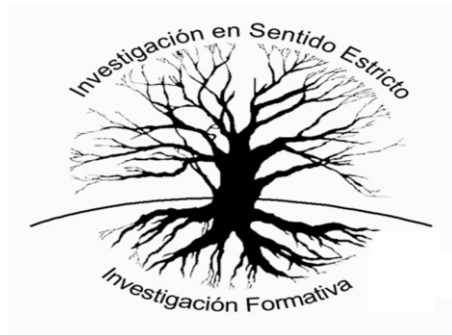
Figura 3: fuente propia

La investigación formativa semilla de la investigación en sentido estricto.