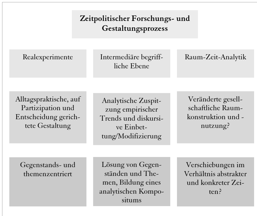
Abb. 3: Zeitpolitischer Forschungs- und Gestaltungsprozess: eigene Darstellung