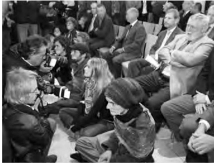
Aktionismus der Studierenden bei der Eröffnung eines Institutsgebäudes. Quelle: unsereuni.at; Bildmitte unten: Wissenschaftsminister Johannes Hahn. Quelle: Der Standard/Matthias Cremer

Bilder, um auf seine Interessen aufmerksam zu machen. Öffentliche politische Inszenierungen werden als Bühne für friedlichen Aktionismus genutzt, um die Politiker zu unfreiwilligen Darstellern einer Posse zu machen: Ein nervöser Wissenschaftsminister steigt über gefesselte und ›normiert‹ geknebelte, zum Schweigen und Zuhören verurteilte Studierende