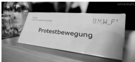
›Namensschild‹ für den vom Wissenschaftsmi- nisterium einberufenen Hochschuldialog.

Der Protest ist dabei keineswegs seiner Materialität enthoben: Ohne die Raumnahme als Druckmittel gegenüber Rektorat und Regierung, der Volkküche als Verpflegungsstelle und der traditionellen Geste des Handhebens bei Abstimmungen im Plenum wäre die Bewegung nicht denkbar. Ausschlaggebend für den Erfolg der Bewegung ist jedoch ihr massenmedialer impact , welcher nur auf Basis seiner internen Organisation nachvollzogen werden kann. Um Druck auf politischer Ebene zu erzeugen, wurden klassische Medien bespielt, doch nach den Regeln der virtuellen Protestbewegung: In hohem Tempo und massiver, vielgesichtiger Präsenz, ohne persönlich identifizierbaren Absender, ohne Identifikationsfiguren oder (Für-)Sprecher, unabhängig von hochschul- oder parteipolitisch etablierten Gruppen. Webstream und Wiki kreieren eine selbstbestimmte, transparente Bühne für öffentliche Bildungsdebatten, die Diffamierungsversuche von konservativer Seite postwendend entlarvt 3 und sich von vandalistischen Ausfällen Einzelner distanziert. Das basisdemokratische Protestmodell des ›Audimaxismus‹ ist ohne die neu-