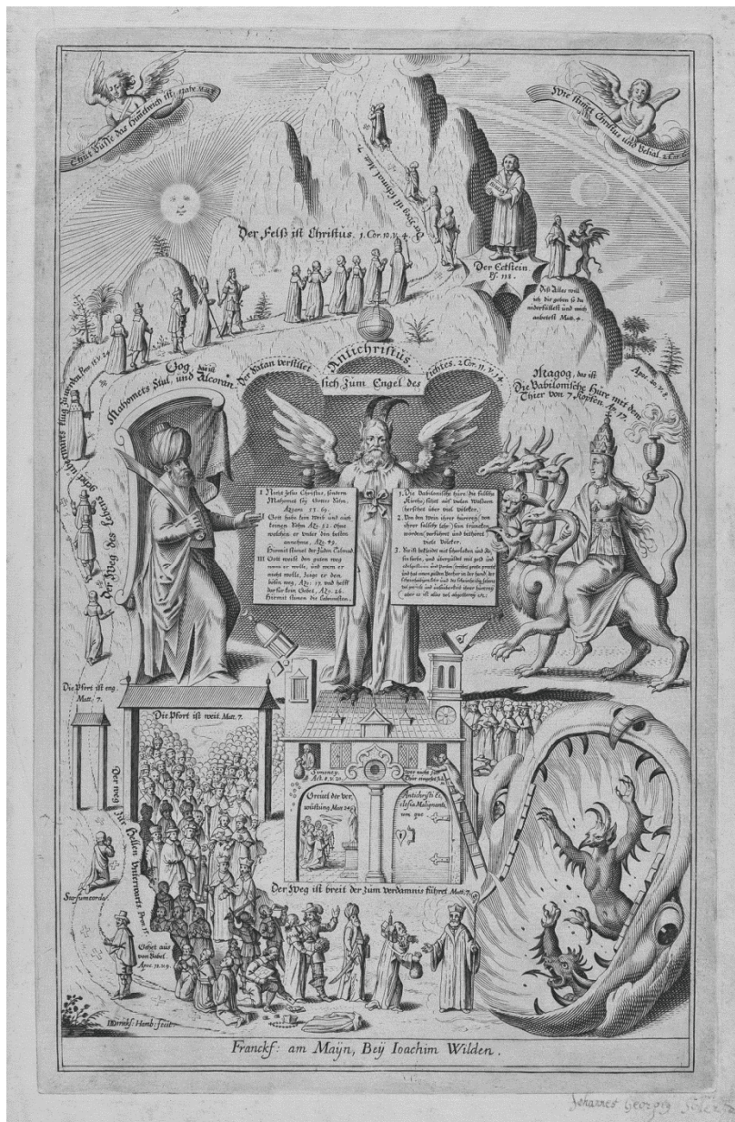
Quelle: Kunstsammlungen der Veste Coburg, Inv.-Nr.: II, 279, 4c; Blattgröße: 36,9 x 23,3 cm.