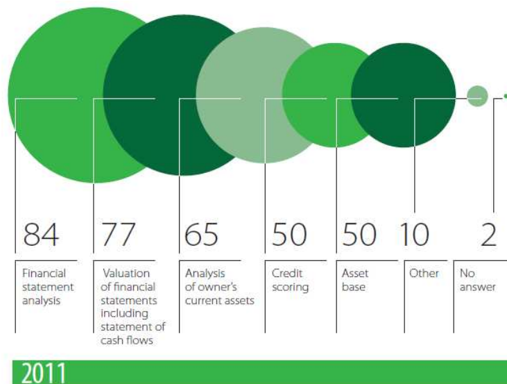
Figura 2 Ferramentas usadas para a análise de crédito de PME

Grupo BID, Felaban – Pesquisa Regional de PME 2011