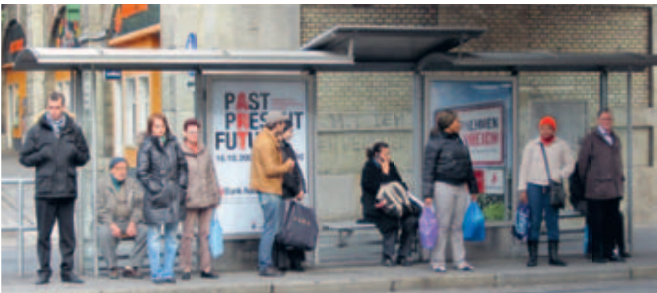
Bild 6: Wien, U-Bahn- und Straßenbahn-Haltestelle Thaliastraße 2009

Die sichtbare Präsenz kultureller Vielfalt im städtischen Alltag ist auch ein Bild, das allerdings in der Plakat-Bilderwelt kaum zu sehen ist – so ein Ergebnis meiner fotografischen Streifzüge in Wien. Wenn die kulturelle Vielfalt in alltäglichen Interaktionen und Situationen in der öffentlichen Bilderwelt nicht repräsentiert wird, bedeutet dies auch, dass diese Realität rituell nicht bestätigt wird. Es fehlen sichtbare Bezugspunkte für Situationen und Interaktionsformen, in denen kulturelle Vielfalt als Normalität dargestellt wird.