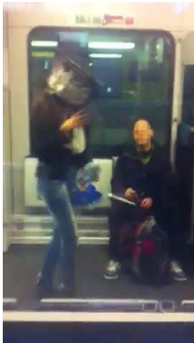
Abb. 6: Filmstill 4