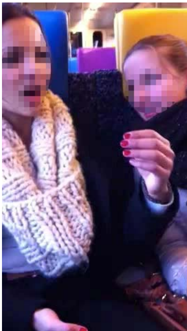
Abb. 3: Filmstill 2