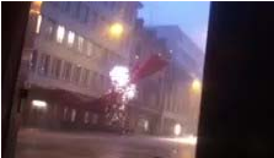
Abb. 2: Filmstill 1