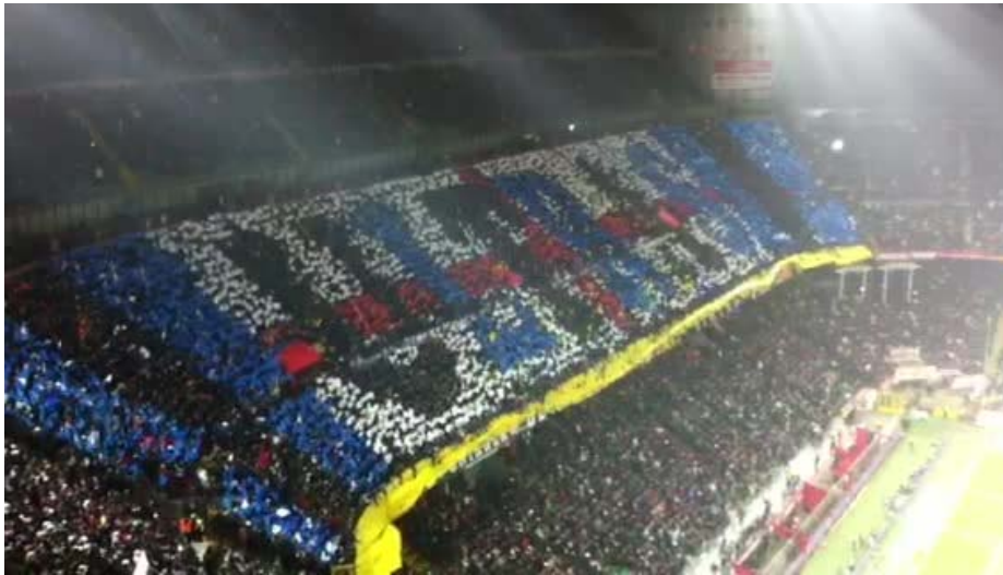
Abb. 7: Filmstill 5