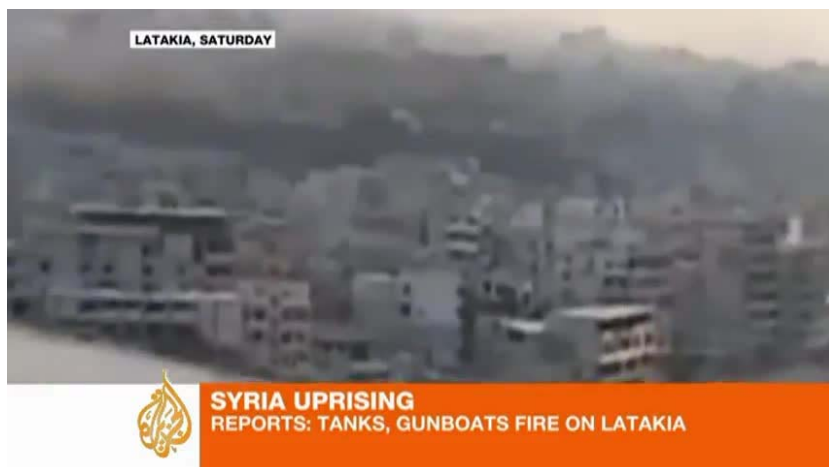
Abb. 4: Screenshot YouTube-Video, „Al Jazeera English: Syria opposition member talks to Al Jazeera“