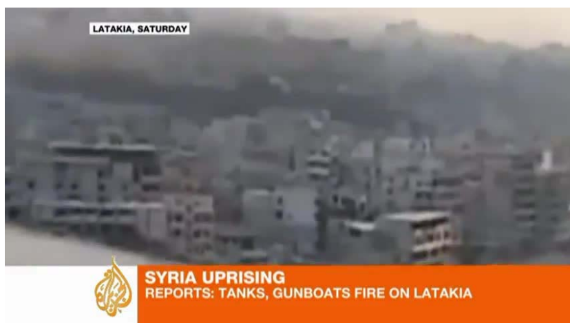
Abb. 4: Screenshot YouTube-Video, „Al Jazeera English: Syria opposition member talks to Al Jazeera“

(25.04.2013).