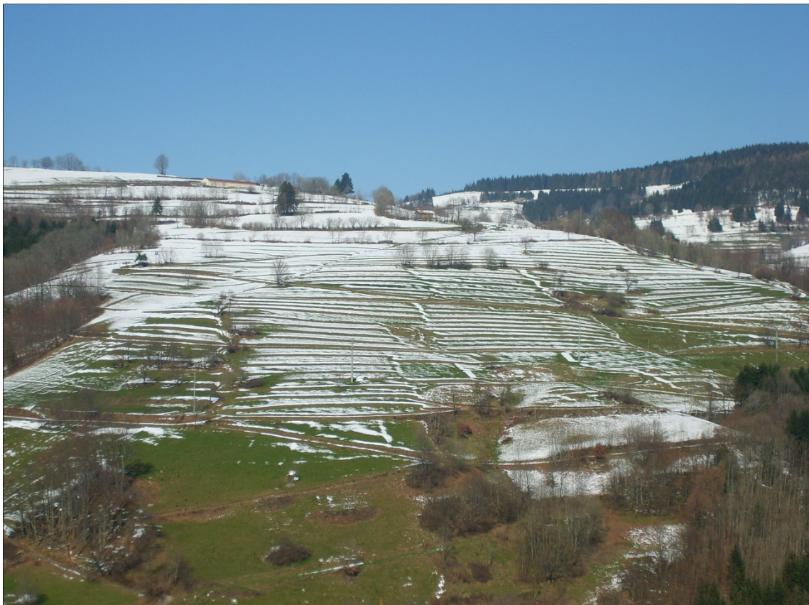
Abb. 2: Terrassenstrukturen mit Stufenrainen (Gemarkung Häg-Ehrsberg)

Ein erheblicher Teil der Gemarkung ist geprägt von den Parzellen der aufgeteilten Allmende