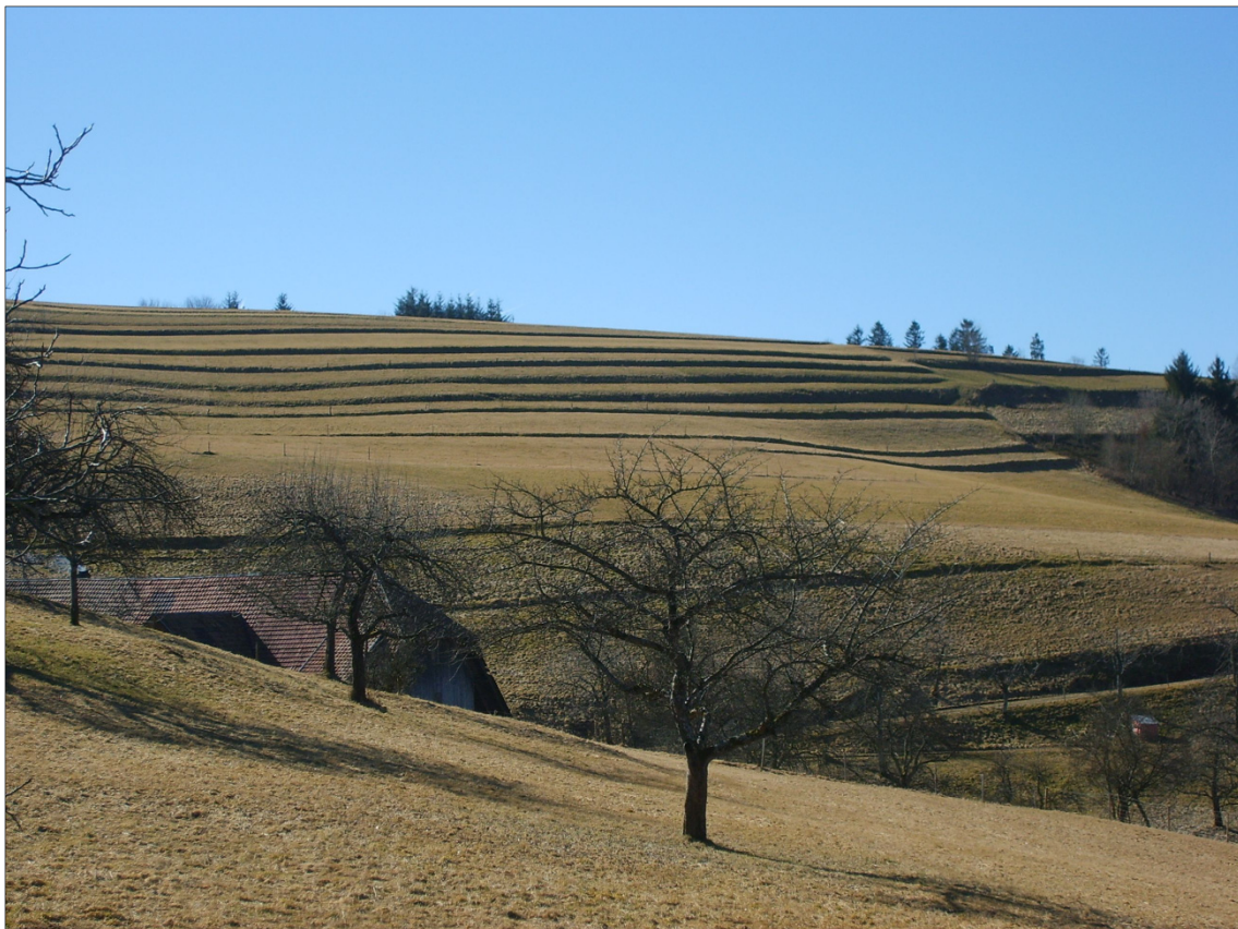
Abb. 3: Ein typischer Ausschnitt aus der Gemarkung von Fröhnd

Merkmale: Grünland, kleinparzelliertes Gelände um die Wohnplätze, ungeteilte Allmende in den entfernteren Lagen, zahlreiche Gehölzstrukturen