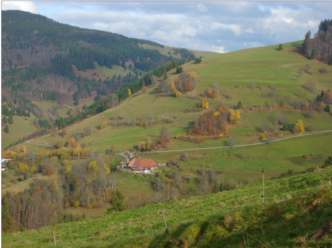
Abb. 4: Ein Teil der Allmende in der Gemarkung Häg-Ehrsberg

Dieser Teil der Allmende wird noch traditionell genutzt und vermittelt einen „archaischen“ Eindruck.