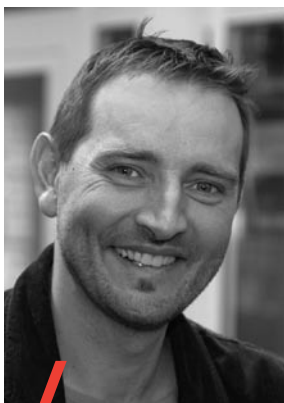
Jürg Guggisberg Büro BASS

Die IV-Stellen sind in der Lage, die Wirksamkeit der beruflichen Massnahmen zu steigern. Dies zeigt die vom BSV beim Büro für arbeits- und sozialpolitische Studien (Büro BASS) in Auftrag gegebene Evaluation der Arbeitsvermittlung in der Invalidenversicherung. Dafür müssen die Strukturen und Prozesse innerhalb der IV-Stellen neu gestaltet und angepasst werden. Eine grosszügige Ausgestaltung der Einleitungspraxis von beruflichen Massnahmen, interdisziplinär zusammengesetzte Arbeitsteams und kurze Entscheidungswege, die Steuerung der Mitarbeitenden durch Zielvorgaben und ein offensiver Auf- und Ausbau des Arbeitgebernetzes sind mögliche Massnahmen, die in ihrem Zusammenspiel zu den erwünschten Resultaten führen können. Dennoch ist es fraglich, ob allein mit einem Ausbau der Ressourcen, Veränderungen der Organisation und einer Erweiterung des Instrumentenkastens letztlich das Eingliederungsziel für eine Mehrheit der KlientInnen erreicht werden kann.