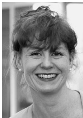
Theres Egger Büro BASS

Der Evaluationsauftrag umfasste die Analyse des Vollzugs und der Wirkungen der beruflichen Massnahmen auf die Adressaten und Endbegünstigten unter den gesetzlichen Rahmenbedingungen der 4. IV-Revision. Gegenstand der Evaluation waren demnach nicht die mit der 5. IV-Revision eingeführten neuen Eingliederungsinstrumente und die Ausweitung des Anspruchs auf Eingliederungsmassnahmen. Die Evalu-