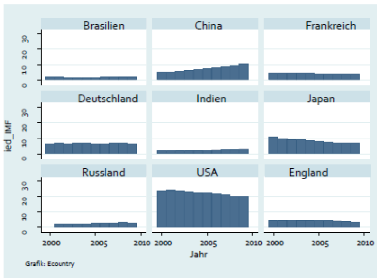
Abbildung 1: Index der wirtschaftlichen Dominanz

Quelle: Kappel/Pohl 2012; die Berechnungen basieren auf einem Modell von Subramanian (2011) und enthalten Brutto sozialprodukt (gewichtet mit 0,6), Handelsanteil (0,35) plus externe finanzielle Stärke (0,05).