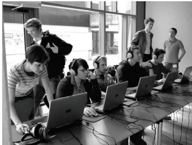
Abbildung 1: Das Mobillabor im Einsatz in der Mensa der Universität Bremen

den Grad der Umverteilung der Ansprüche, festzulegen. Am Ende wurden die Versuchspersonen tatsächlich einer der fünf Einkommenspositionen zugelost und erhielten die entsprechende Auszahlung in bar. In einigen Szenarien lag der Höchstgewinn bei über 1000 €. Was hat