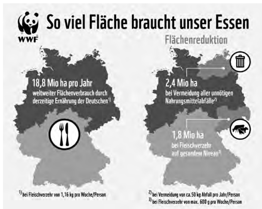
Abbildung 2: So viel Fläche braucht unser Essen.

Insgesamt ließe sich der durchschnittliche derzeitige Fußabdruck von 2900 Quadratmeter pro Person allein durch eine gesündere Ernährung sowie durch eine signifikant geringere Lebensmittelverschwendung um über 500 Quadratmeter reduzieren.