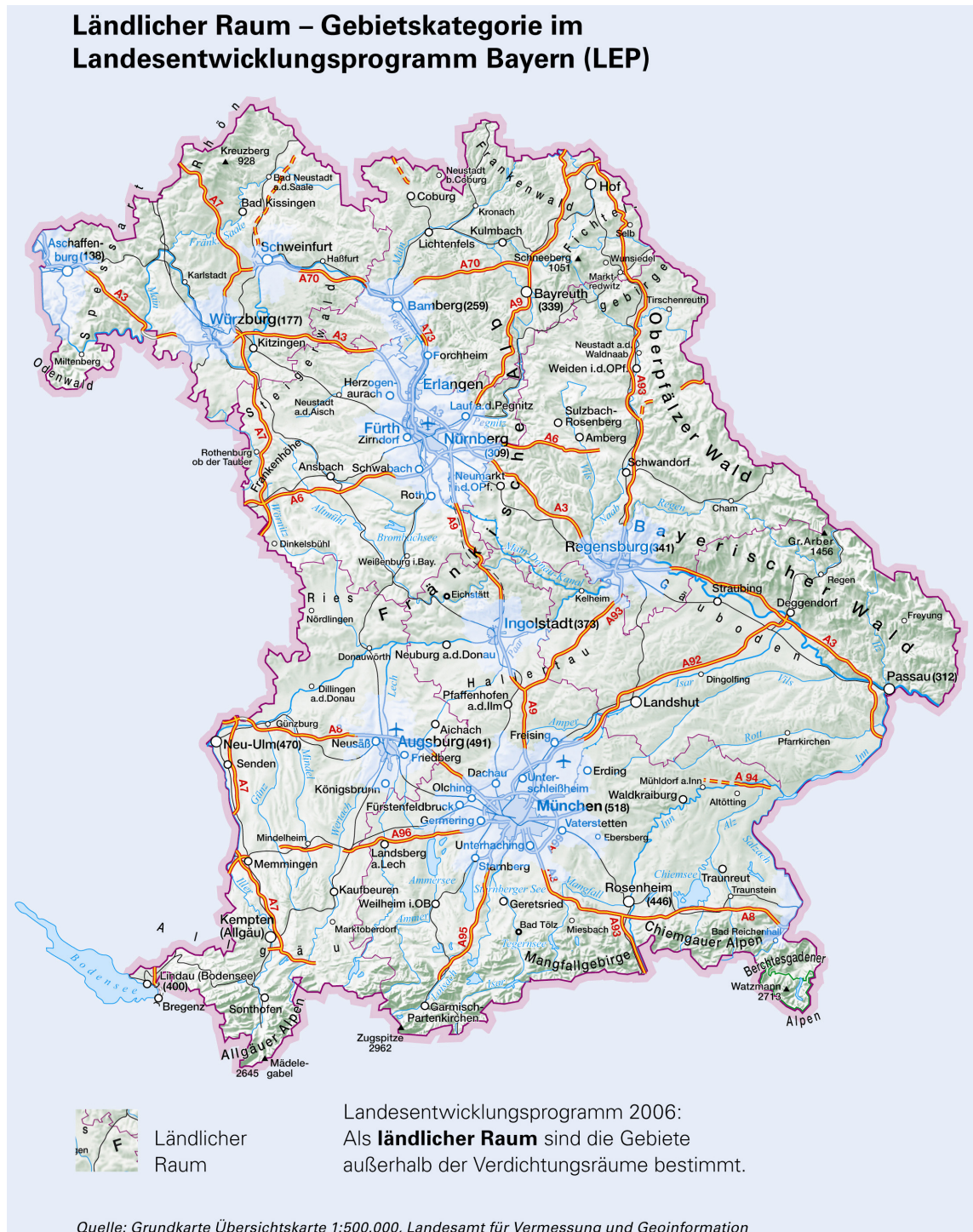
Abb. 1: Strukturkarte