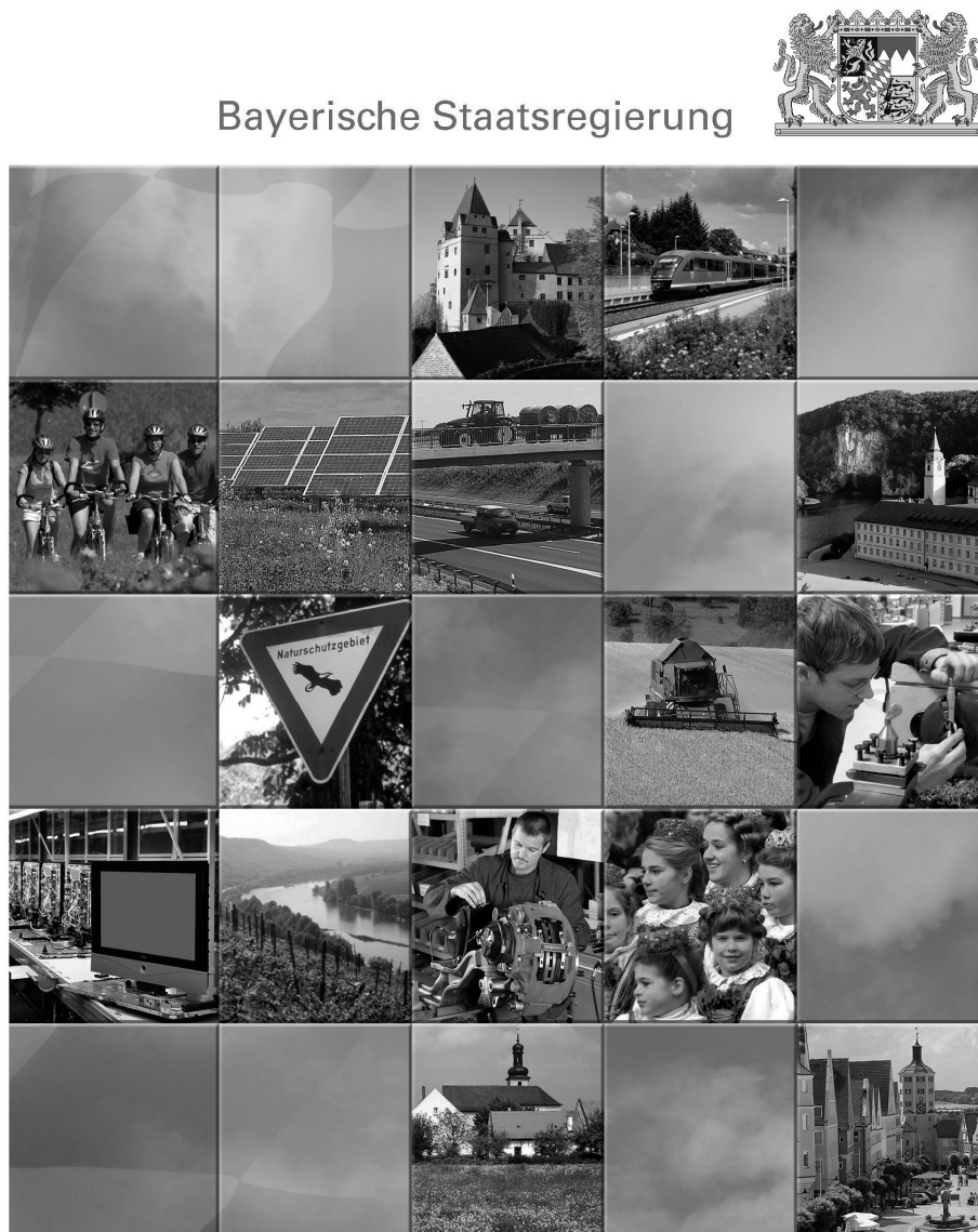
Abb. 4: Aktionsprogramm Bayerns ländlicher Raum

Eigenständigkeit bewahren Entwicklung nachhaltig gestalten Zukunftsfähigkeit sichern