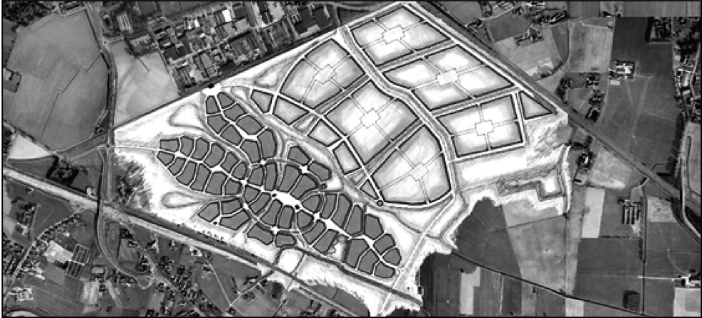
Abb. 1: Entwurf der Stadteilerweiterung Zevenaar-Oost von Krier und Kohl