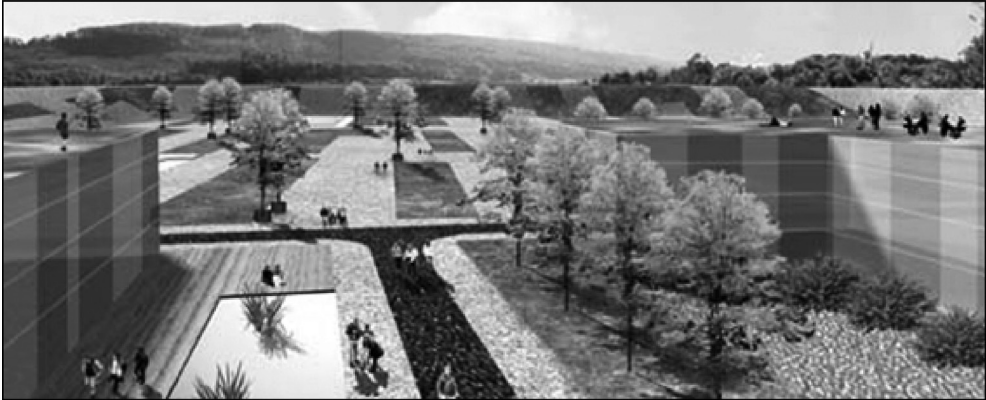
Abb. 3: Entwurf des Büros yellowz