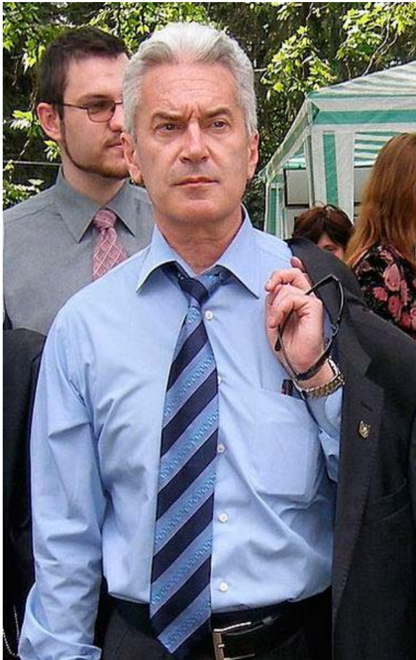
Volen Siderov Nikolov dirigente del partido Attack

which one believes to be the best in the world, but does not try to force upon other people to accept it. 5 On the other hand nationalism is most powerful weapon for political change “placing the state beyond good and evil and recognizing no other duty than that of advancing state’s interests.” 6 This explains why the people in the way of hating their unfriendly neighboring country, mean that they actually like their own one and present themselves as patriots. This problem can be solved only with raising the people’s awareness for distinction of these two notions.