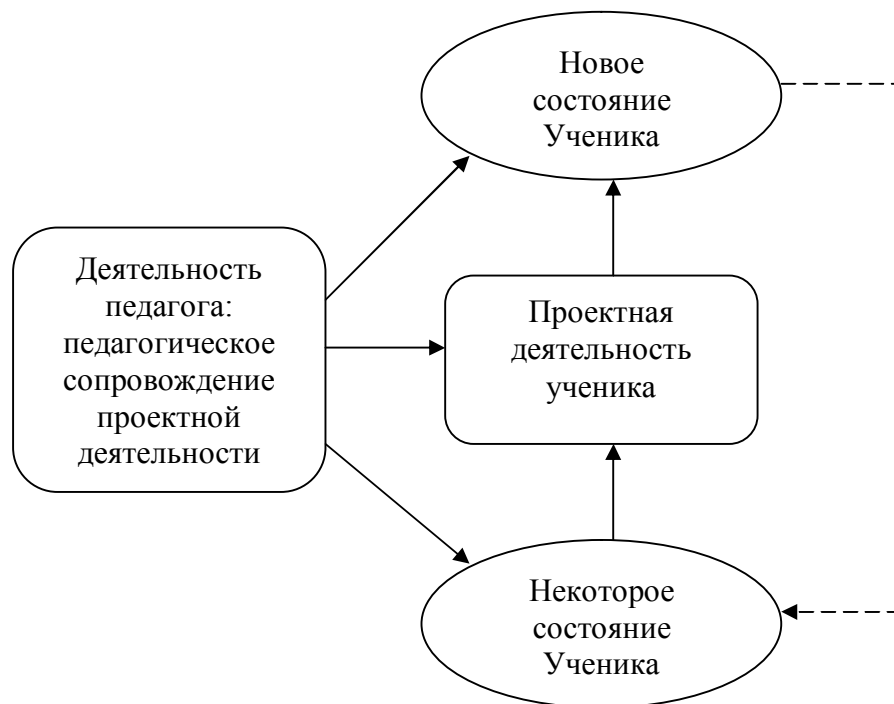
Рис. 1. Взаимодействие систем: деятельность педагога и качественное состояние ученика

прогресса. Вторая представляет собой деятельность педагога по целенаправленному сопровождению проектной деятельности учеников. Схематично это взаимодействие можно отразить следующим образом (см. рисунок 1).