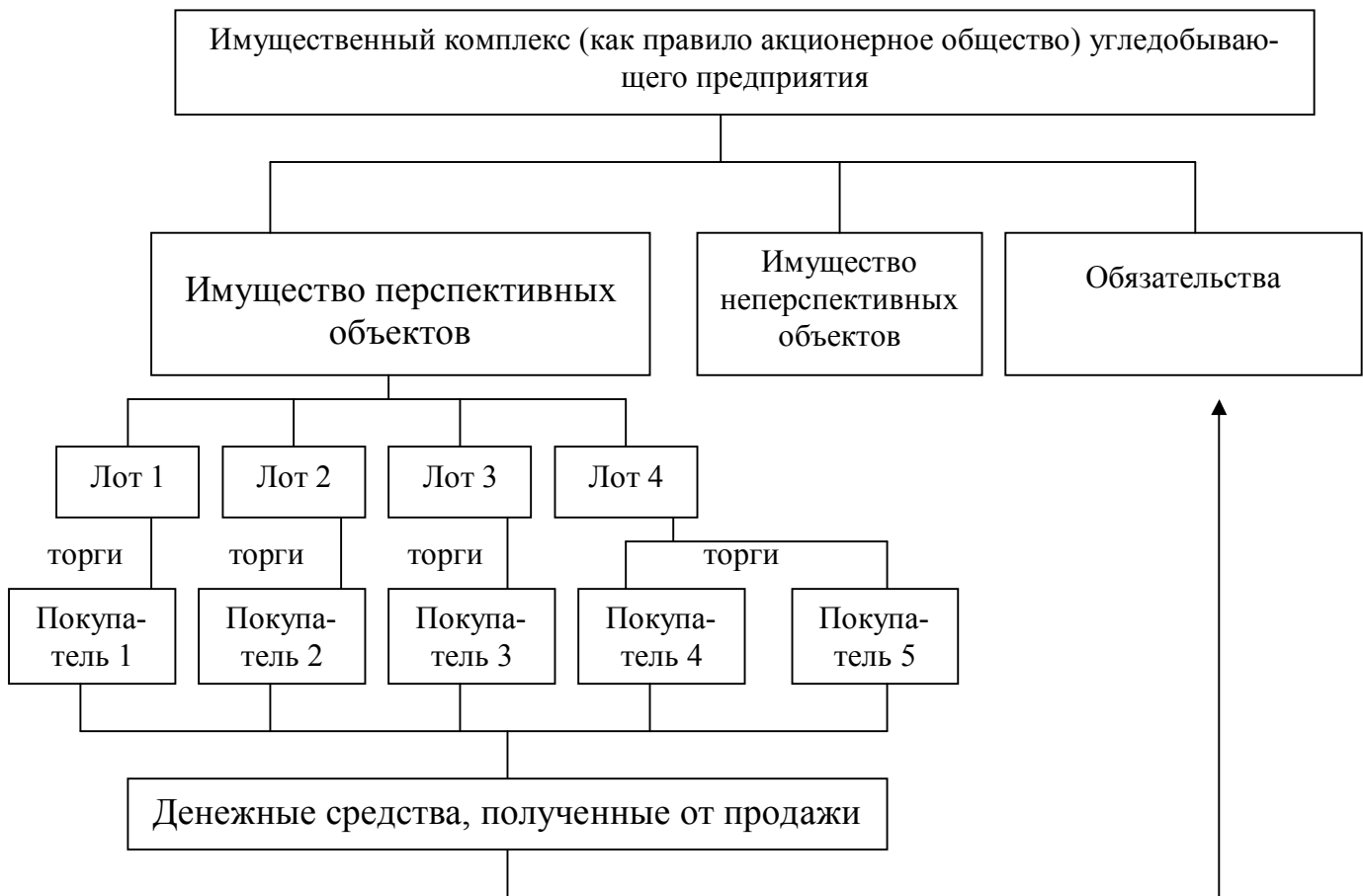
Рис. 2. Схема продажи лота через процедуру банкротства

Особенностью продажи предприятия в связи с банкротством является то, что денежные обязательства и обязательные платежи должника на дату принятия арбитражным судом заявления о признании должника банкротом не включаются в состав предприятия, за исключением обязательств должника, которые возникли после принятия заявления о признании должника банкротом и могут быть переданы покупателю предприятия в порядке и на условиях, которые установлены Федеральным законом №127-ФЗ. При этом все трудовые контракты, действующие на момент продажи предприятия, сохраняют силу, и права и обязанности работодателя переходят к покупателю предприятия.