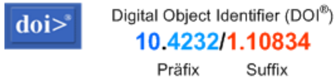
Abbildung 4: Struktur eines DOI-Namens

Die „10“ identifiziert den Typ des gesamten Identifiers (Präfix und Suffix) als DOI. Der zweite Teil des Präfixes ist der eindeutige (ab 1000 aufsteigende) Code einer registrierten Organisation (Datenzentrum bzw. Datenanbieter), die Objekte (Dokumente, Forschungsdaten etc.) im DOI-System eingetragen hat. Dieser Code des sog. Publikationsagenten bleibt dauerhaft gültig, unabhängig von späteren Änderungen der Rolle dieser Einrichtung bei der Unterhaltung der angemeldeten DOI-Namen. Das Präfix wird von der IDF verwaltet und durch eine Registrierungsagentur wie DataCite und den dazugehörigen Allocation Agencies den Publikationsagenten zugewiesen.