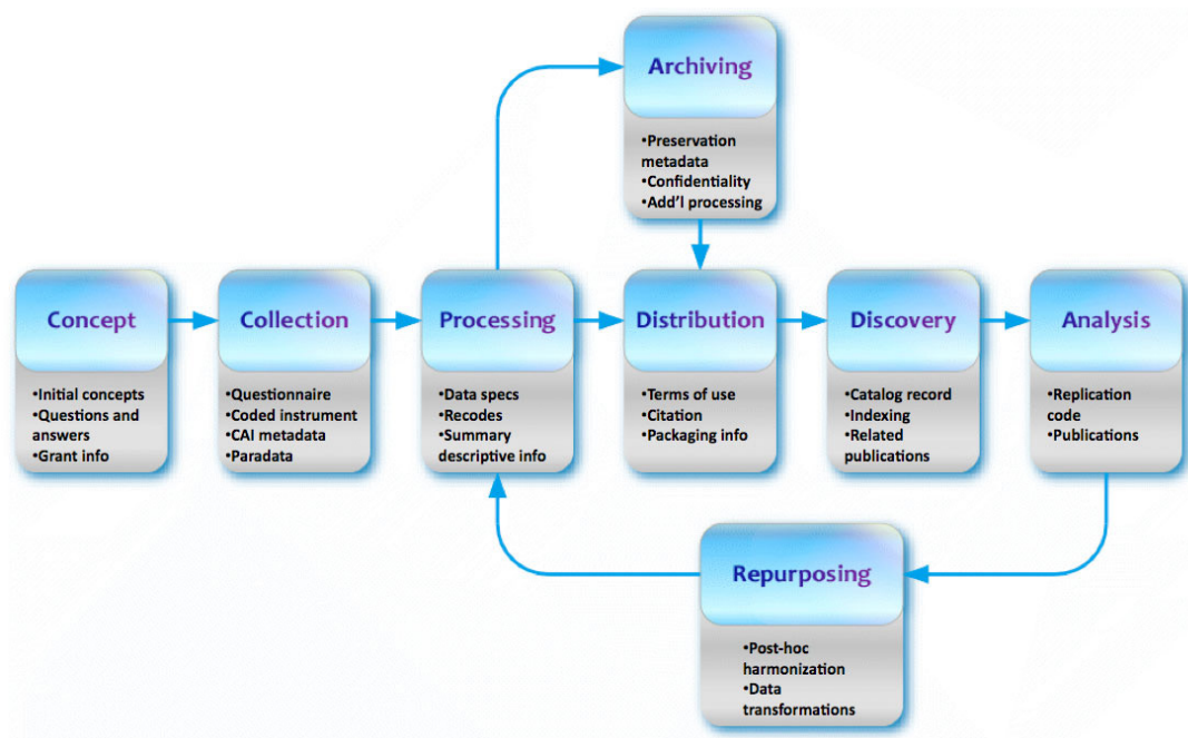
Abbildung 3: Unterstützung des Forschungsdatenzklus durch die DDI-Lifecycle Spezifikation

Die Alliance verfolgt in den letzten Jahren mit der Entwicklung der DDI-Lifecycle Version das Ziel, den Lebenszyklus sozialwissenschaftlicher Forschungsdaten möglichst vollständig durch Metadaten zu beschreiben. Die wesentlichen Strukturen und Informationen, die diese zwei Standards kennzeichnen, werden im Folgenden kurz vorgestellt.