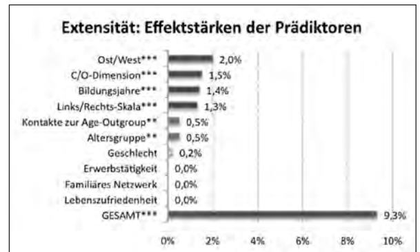
Abbildung 3: Effektstärken der Prädiktoren. Hierarchisiert nach dem semipartiellen R^2 -Quadrat, prozentual an gesamter Varianz. Gerundete Werte. Signifikanzniveau: * : p < 0,05 ; ** : p < 0,01 ; *** : p < 0,001 .

grundsätzlicher normativer Orientierungen und spezifischer Sozialisationserfahrungen ist. Wenn es Konfliktpotenzial gibt, dann ist es hier, in Form eines Wertekonfliktes bezüglich der politischen Einstellung oder der Sicherheitsorientierung bzw. des Veränderungswillens, zu vermuten. Oder aber als Konflikt zwischen gut und gering gebildeten Personen, die durch ihre jeweiligen Möglichkeiten der Einkommensgenerierung und alternativen Altersvorsorge in unterschiedlichem Maße auf den Staat angewiesen sind.