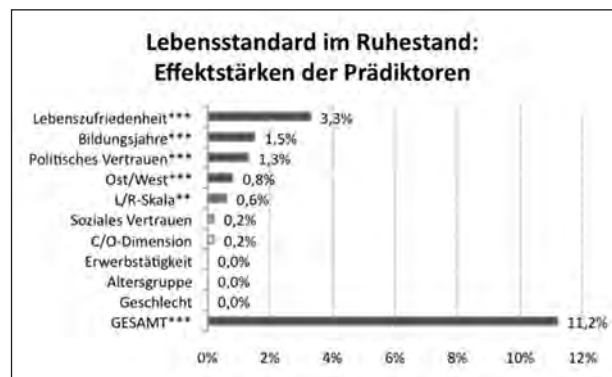
Abbildung 4: Effektstärken der Prädiktoren. Hierarchisiert nach dem semipartiellen R-Quadrat, prozentual an gesamter Varianz. Gerundete Werte. Signifikanzniveau: *: p < 0,05 ; **: p < 0,01 ; ***: p < 0,001 .

Neben der Frage, was der Staat bei der Alterssicherung leisten soll, bedarf es auch der Analyse, was er zukünftig überhaupt zu leisten fähig ist. Krömmelbein sieht den Diskurs über eine Krise der sozialen Sicherung vorrangig auf die zukünftige Überlastung der Sicherungssysteme bezogen, weniger auf die aktuelle Situation. 58 Unterschiedliche Zukunftserwartungen können eine entscheidende Rolle in potenziellen Alters-