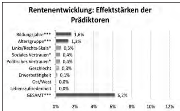
Abbildung 5: Effektstärken der Prädiktoren. Hierarchisiert nach dem semipartiellen Pseudo R-Quadrat von Nagelkerke, prozentual an gesamter Devianz des Nullmodells. Gerundete Werte.

Rentenniveau in Anbetracht der demografischen Entwicklung und der rapide zunehmenden Staatsverschuldung in Zukunft eben nicht ohne Weiteres zu leisten ist, an Gewicht gewinnen. Ob und wie sehr diese Verschiebung des Konfliktpotenzials von Alters- hin zu Bildungsunterschieden stattfinden wird, bleibt abzuwarten.