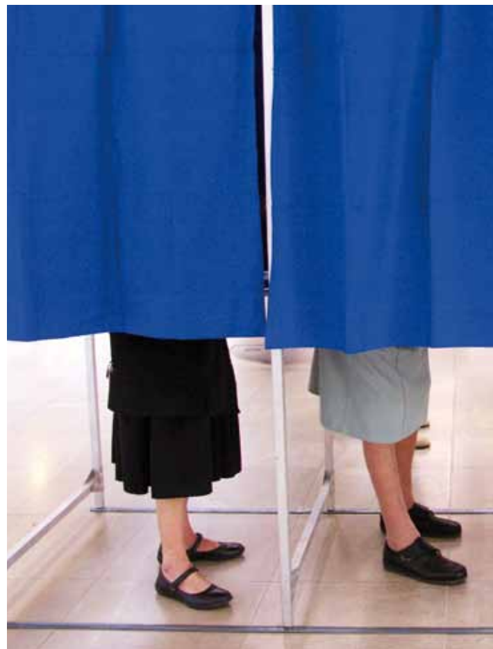
Barrierefreie Wahllokale, assistierte Stimmabgabe oder Stimmzettel-Schablonen für blinde Menschen sind in der Praxis noch keine Selbstverständlichkeit.

Um breitere Kreise für das Thema zu gewinnen, veröffentlichte die Monitoring-Stelle im Oktober das Policy Paper „Gleiches Wahlrecht für alle? Menschen mit Behinderungen und das Wahlrecht in Deutschland“. Das Grundsatzpapier erläutert die gesetzliche