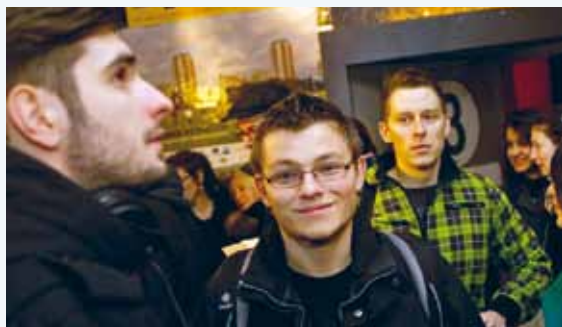
Menschenrechtsbildung beim Kinobesuch

Auf Einladung des Instituts sahen sich rund 200 Berliner Schülerinnen und Schüler Ende November 2011 Filme zum Thema Menschenrechte an. Das dreitägige Festival „Look at Human Rights!“ fand zum dritten Mal im Rahmen der Berliner Schulkinowochen in Kooperation mit VISION KINO, dem JugendKulturService und dem ONE WORLD Filmfestival Berlin statt.