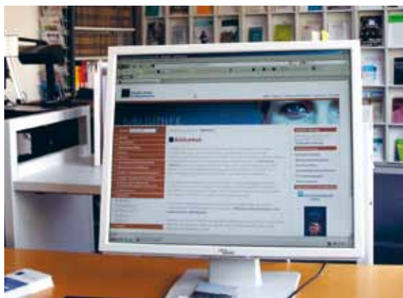
Eine einzigartige Sammlung deutschsprachiger Informationen zum Menschenrechtsschutz: die Website des Instituts

Im September 2011 kam diese Website hinzu – eine einzigartige Sammlung an Informationen, Spielen und pädagogischen Methoden zu den Themen Inklusion, Behinderung und Menschenrechte. Zielgruppen sind insbesondere Multiplikatorinnen und Multiplikatoren in der politisch-historischen Bildung sowie der schulischen und außerschulischen Bildungsarbeit mit jungen Menschen ab 16 Jahren.