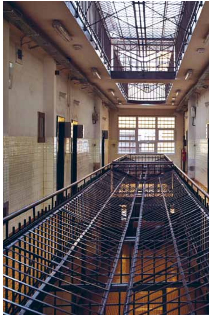
In manchen europäischen Ländern sind Gefängnisse und Heime in einem desolaten Zustand.

Nach jedem Besuch erstellen wir einen zunächst vertraulichen Bericht mit Empfehlungen für die Regierung. Dieser wird in der Regel später zusammen