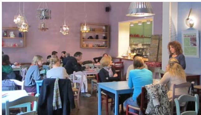
Abb. 4: Mittag in der Weltküche 62

Die Graefewirtschaft wurde mehrfach für ihr Konzept ausgezeichnet: sie erhielt den Berliner Preis „Soziale Stadt“, den Preis für bürgerschaftliches Engagement der Stiftung „Bürger für Bürger“ und wurde von der Initiative „Deutschland – Land der Ideen“ zum „Ausgewählten Ort 2011“ ernannt. 63