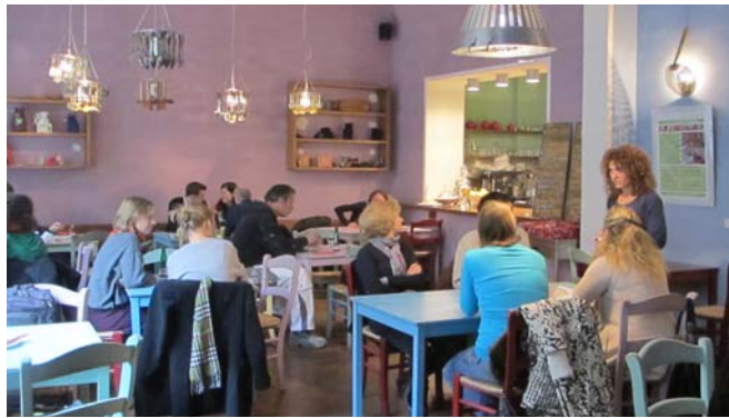
Abb. 4: Mittag in der Weltküche 62

Die Graefewirtschaft wurde mehrfach für ihr Konzept ausgezeichnet: sie erhielt den Berliner Preis „Soziale Stadt“, den Preis für bürgerschaftliches Engagement der Stiftung „Bürger für Bürger“ und wurde von der Initiative „Deutschland – Land der Ideen“ zum „Ausgewählten Ort 2011“ ernannt. 63