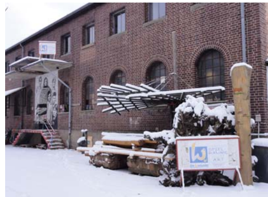
Abb. 3: Werkstattgebäude der Werkstatt eG

Das Hauptaufgabenfeld der Werkstatt eG ist die Planung und Realisierung von künstlerisch gestalteten Spielplätzen. Der soziale Fokus des Unternehmens liegt in der Integration junger sowie älterer Arbeitsloser in die Berufswelt mittels Qualifikation und Ausbildung. Dabei sollen die Jugendlichen die Gewerke unter fachkundiger Anleitung kennen lernen und so auf eine reguläre Ausbildung vorbereitet werden. Ihnen und den Langzeitarbeitslosen werden Perspektiven aufgezeigt, wie sie Wege aus ihrer Arbeitslosigkeit finden und dabei neues Selbstbewusstsein entwickeln können.