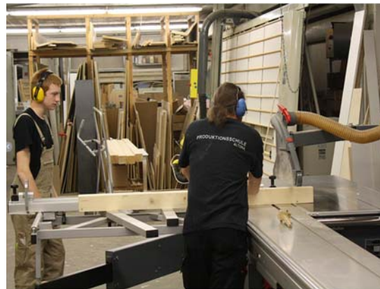
Abb. 6: Tischlerei, Produktionsschule Altona 72

Finanziert wird die Produktionsschule von der Schulbehörde und den Einnahmen aus den Kundenaufträgen. Die Produktionsschule erhält von der Schulbehörde monatlich 750 € für anwesende Teilnehmer, davon müssen jeweils rund 100 € als Aufwandsentschädigung abgezogen werden. Wenn Teilnehmer abgemeldet werden müssen, erhält die Produktionsschule kein Geld, es sei denn der frei gewordene Platz kann neu besetzt werden. Da diese Finanzierung nicht ausreicht, muss die Schule darüber hinaus eigene Einnahmen generieren. Der Umsatz aus den Kundenaufträgen betrug 2011 ca. 130.000 €. Zusätzlich ist die Schule auf weitere Förderer und Sponsoren angewiesen. So beteiligten sich bspw. die Zeitstiftung, die Firma Philips und der Europäische Sozialfonds für einen begrenzten Zeitraum an der Finanzierung der Produktionsschule. 73 Damit liegt der Anteil der Eigenfinanzierung bei 10 bis 15 %.