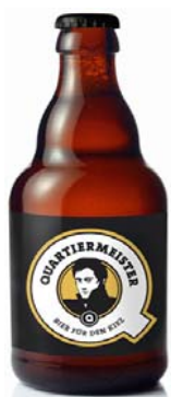
Abb. 5: Quartiermeister Bier 65

Hinsichtlich der sozialen Projekte, die Quartiermeister unterstützt, können auch die Konsumenten Vorschläge einreichen. Die Entscheidung über die Unterstützung fällt der Quartiermeister e.V. 64 , der sich auf entsprechende Förderrichtlinien geeinigt hat. Zu den bisher unterstützten Projekten zählt etwa das Netzwerk Schülerhilfe 65 Rollberg, bei dem Kindern Paten an die Seite gestellt werden, um ihnen bessere Bildungschancen zu ermöglichen. Der Quartiermeister e.V. konnte den erforderlichen Fehlbetrag für die Betreuung von zwei Kindern decken. Ein weiteres unterstütztes Projekt war das Cosy Concerts Musikzimmer Festival 2011, bei dem verschiedene Musiker zu sich nach Hause einluden, um die Besucher mit klassischer Musik vertraut zu machen. 66