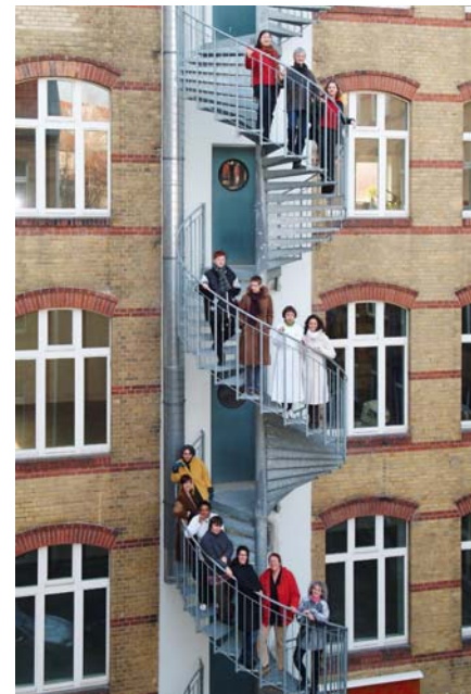
Abb. 2: Hof WeiberWirtschaft eG

Die WeiberWirtschaft eG ist eine 1989 in Berlin gegründete Frauengenossenschaft mit zurzeit ca. 1.650 Mitgliedern. Die WeiberWirtschaft setzt mit ihrem innovativen unternehmerischen Ansatz, aus damaliger Perspektive, an zwei Schwachpunkten an: der niedrigen Frauenquote bei Unternehmensgründungen und der Benachteiligung von Frauen bei der Kreditvergabe. Mit der WeiberWirtschaft haben die Gründerinnen unterstützende Infrastruktur geschaffen, um diese Benachteiligungen abzubauen. Hinzu kommt auch die Verfolgung ökologischer Interessen – in ihrem Gebäude in der Rosenthaler Vorstadt nutzt die WeiberWirtschaft u.a. regenerative Energieträger und verfügt über eine Regenwassernutzungsanlage sowie ein gemeinsames Sammel- und Entsorgungssystem mit Rückführung von Wertstoffen und Kompostierung von Gartenabfällen. Für ihr stadtökologisches Gesamtkonzept wurde der WeiberWirtschaft 2004 der NABU-Baupreis verliehen.