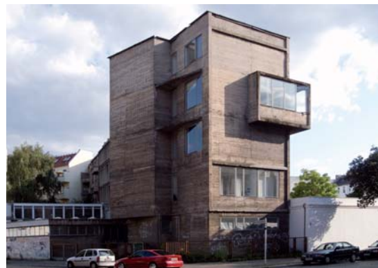
Abb. 7: Gebäude ExRotaprint

Das Gelände des Druckmaschinenherstellers Rotaprint in Berlin-Wedding stand seit dessen Pleite im Jahr 1989 leer. 2003 übernahm der Berliner Liegenschaftsfond die Verwaltung des gesamten Geländes, mit dem Ziel dieses zu verkaufen. Allerdings fand sich kein Käufer. In der Folge wurde das Gelände in zwei Hälften geteilt; in der einen siedelte sich ein Discounter an, die andere Hälfte wurde von Künstlern, Initiativen und Gewerbetreibenden genutzt. Der Liegenschaftsfond versuchte dennoch weiterhin das Gelände zu verkaufen – nachdem der geplante Verkauf an einen isländischen Investor 2007 gescheitert war, nahm der Liegenschaftsfond wieder Verhandlungen mit ExRotaprint e.V. auf, der sich 2005 rund um die dort ansässige Künstlergruppe „soup“ gegründet und bis dahin erfolglos um den Kauf des Geländes bemüht hatte. Mit der Unterstützung durch die Stiftungen trias 74 und Edith Maryon 75 konnte die aus dem Verein heraus gegründete gemeinnützige ExRotaprint GmbH das Gelände schließlich als Erbbaurechtnnehmerin übernehmen. 76