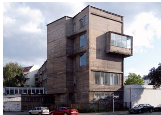
Abb. 7: Gebäude ExRotaprint

Das Gelände des Druckmaschinenherstellers Rotaprint in Berlin-Wedding stand seit dessen Pleite im Jahr 1989 leer. 2003 übernahm der Berliner Liegenschaftsfond die Verwaltung des gesamten Geländes, mit dem Ziel dieses zu verkaufen. Allerdings fand sich kein Käufer. In der Folge wurde das Gelände in zwei Hälften geteilt; in der einen siedelte sich ein Discounter an, die andere Hälfte wurde von Künstlern, Initiativen und Gewerbetreibenden genutzt. Der Liegenschaftsfond versuchte dennoch weiterhin das Gelände zu verkaufen – nachdem der geplante Verkauf an einen isländischen Investor 2007 gescheitert war, nahm der Liegenschaftsfond wieder Verhandlungen mit ExRotaprint e.V. auf, der sich 2005 rund um die dort ansässige Künstlergruppe „soup“ gegründet und bis dahin erfolglos um den Kauf des Geländes bemüht hatte. Mit der Unterstützung durch die Stiftungen trias 74 und Edith Maryon 75 konnte die aus dem Verein heraus gegründete gemeinnützige ExRotaprint GmbH das Gelände schließlich als Erbbaurechtnemerin übernehmen. 76