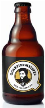
Abb. 5: Quartiermeister Bier 65

Hinsichtlich der sozialen Projekte, die Quartiermeister unterstützt, können auch die Konsumenten Vorschläge einreichen. Die Entscheidung über die Unterstützung fällt der Quartiermeister e.V. 64 , der sich auf entsprechende Förderrichtlinien geeinigt hat. Zu den bisher unterstützten Projekten zählt etwa das Netzwerk Schülerhilfe 65 Rollberg, bei dem Kindern Paten an die Seite gestellt werden, um ihnen bessere Bildungschancen zu ermöglichen. Der Quartiermeister e.V. konnte den erforderlichen Fehlbetrag für die Betreuung von zwei Kindern decken. Ein weiteres unterstütztes Projekt war das Cosy Concerts Musikzimmer Festival 2011, bei dem verschiedene Musiker zu sich nach Hause einluden, um die Besucher mit klassischer Musik vertraut zu machen. 66