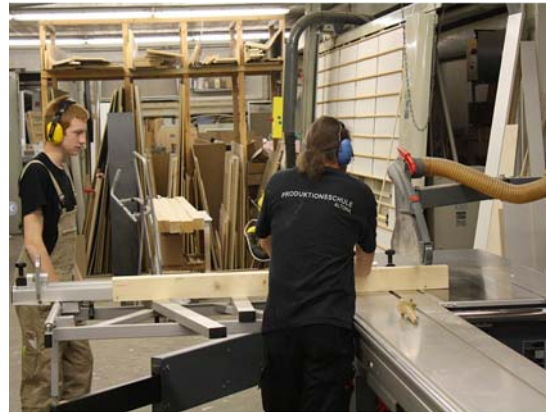
Abb. 6: Tischlerei, Produktionsschule Altona 72

Finanziert wird die Produktionsschule von der Schulbehörde und den Einnahmen aus den Kundenaufträgen. Die Produktionsschule erhält von der Schulbehörde monatlich 750 € für anwesende Teilnehmer, davon müssen jeweils rund 100 € als Aufwandsentschädigung abgezogen werden. Wenn Teilnehmer abgemeldet werden müssen, erhält die Produktionsschule kein Geld, es sei denn der frei gewordene Platz kann neu besetzt werden. Da diese Finanzierung nicht ausreicht, muss die Schule darüber hinaus eigene Einnahmen generieren. Der Umsatz aus den Kundenaufträgen betrug 2011 ca. 130.000 €. Zusätzlich ist die Schule auf weitere Förderer und Sponsoren angewiesen. So beteiligten sich bspw. die Zeitstiftung, die Firma Philips und der Europäische Sozialfonds für einen begrenzten Zeitraum an der Finanzierung der Produktionsschule. 73 Damit liegt der Anteil der Eigenfinanzierung bei 10 bis 15 %.