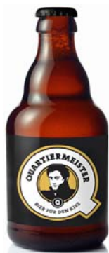
Abb. 5: Quartiermeister Bier 65

Hinsichtlich der sozialen Projekte, die Quartiermeister unterstützt, können auch die Konsumenten Vorschläge einreichen. Die Entscheidung über die Unterstützung fällt der Quartiermeister e.V. 64 , der sich auf entsprechende Förderrichtlinien geeinigt hat. Zu den bisher unterstützten Projekten zählt etwa das Netzwerk Schülerhilfe 65 Rollberg, bei dem Kindern Paten an die Seite gestellt werden, um ihnen bessere Bildungschancen zu ermöglichen. Der Quartiermeister e.V. konnte den erforderlichen Fehlbetrag für die Betreuung von zwei Kindern decken. Ein weiteres unterstütztes Projekt war das Cosy Concerts Musikzimmer Festival 2011, bei dem verschiedene Musiker zu sich nach Hause einluden, um die Besucher mit klassischer Musik vertraut zu machen. 66